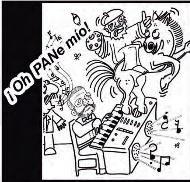
El Gobelino Azul y su secre de finanzas, doña Chafalia Uñas, disfrutaban del soberbio concierto, digno del mejor consultorio dental