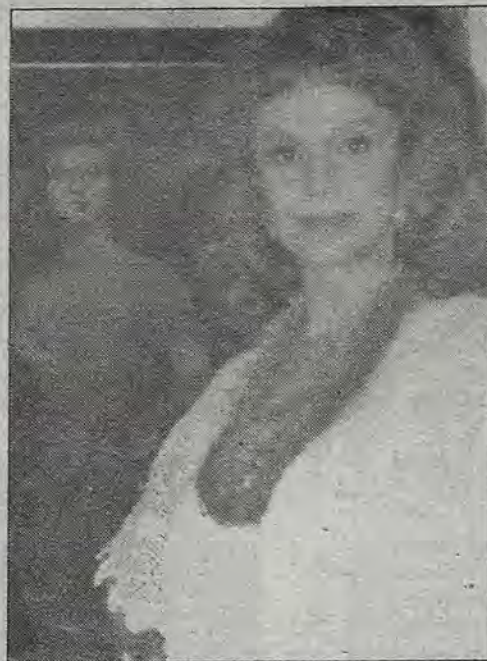
1991. Colonia Nápoles.

donde los espectadores no estén pensando... ¡y ahora qué irá a pasar...?"