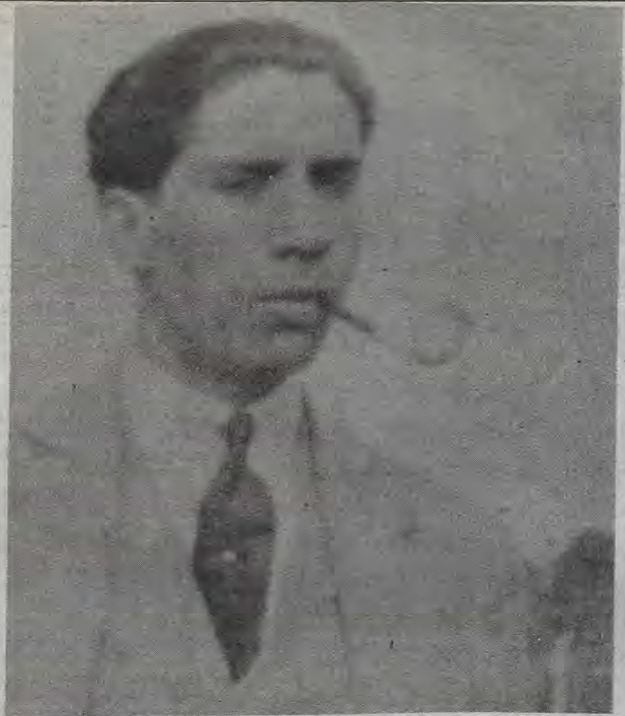
Luis Cardoza y Aragón

Si yo apegara en sentido estricto el término de investigar vería que es cosa de