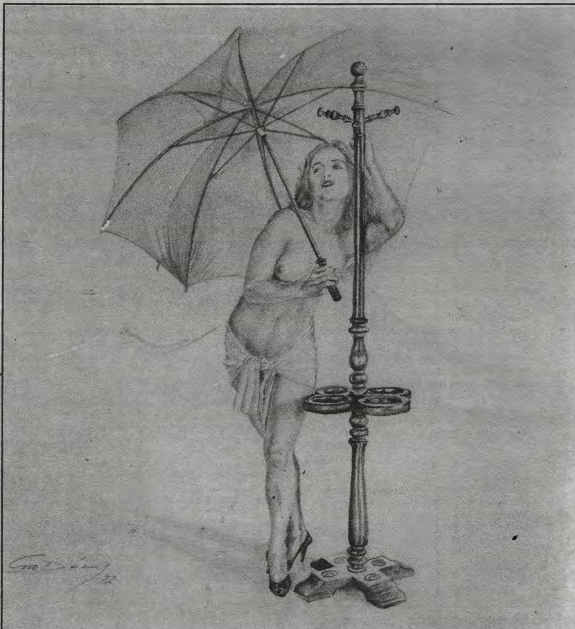
Ilustraciones de Fernando M. Díaz, Ero-Díaz

En mi lecho me habría revolcado de insomnio: Me aburro dormido Y me gusta vivir las auroras.