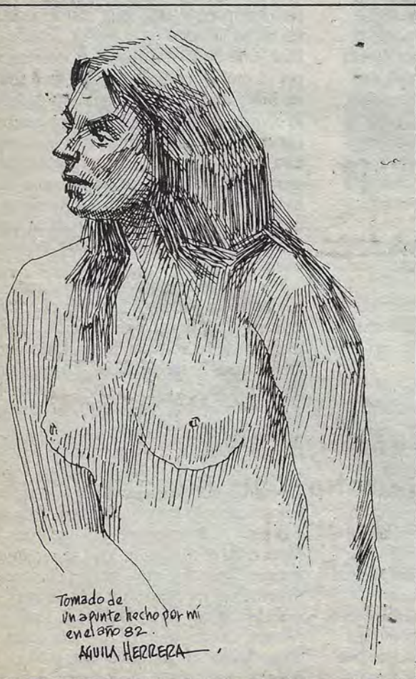
Tomado de un apunte hecho por mí en el año 82. ÁGUILA HERRERA

Digo adiós a Mistrás, la carretera se adentra en el Taigeto y a lo lejos se adivina la luz de Kalamata. Quedó atrás la ciudad que me ha dejado el sabor de la muerte y la precaria certidumbre de vida. La montaña atormenta sus caminos y una tenue neblina desfigura el rostro de las rocas. Pienso en los vivos de la ciudad difunta, en sus canciones de honda madrugada, sus hombres, sus mujeres, el hogar y los niños. Pienso en el pan y el vino que iluminó sus tardes; limito la memoria a los pequeños, a los desconocidos, a los que concibieron esperanzas que liquidó la vida y, sin embargo, seguían agradeciendo los destellos que rescató el amor. Pienso en todas las cosas que formaron sus vidas: las penas, los dolores, la enfermedad, la muerte, la primavera con sus nuevas lilas, los amores, los libros, las palabras, los altos entusiasmos, el mar y las distancias recorridas. Pienso en ellos y sé que al evocarlos renace su memoria: este es un juego inútil, lo comprendo, pero pensar en los demás, en los arrebatados por la muerte, es pensar en nosotros. Somos el mismo río que va pasando, lo dicen los poetas, el río es inmenso y en su seno oscuro habitan las tinieblas, sin embargo, debe haber una luz imperceptible al fondo del fracaso, una luz que encendieron los amores, una luz que vacila y permanece.