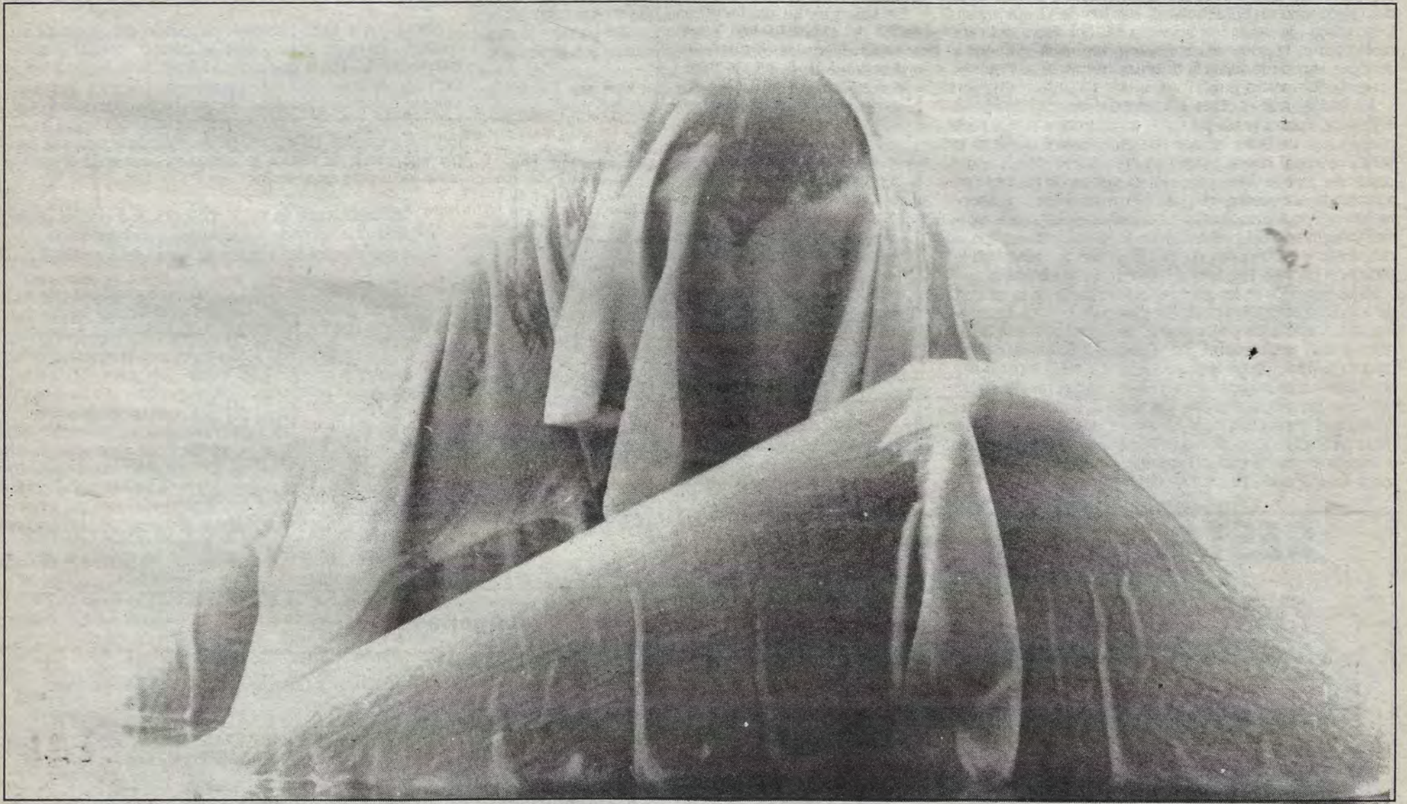
Piernas bañadas por luz acuática.

El movimiento infrarrealista Víctor M. Navarro