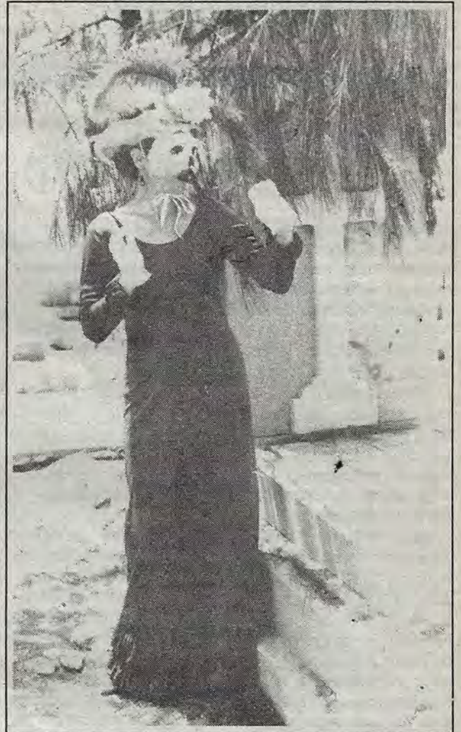
La dama muerta.

¡Querétaro! Se presentan todos los domingos a niños y trabajan permanentemente en sus talleres internos de formación para actores. Banqueta es un esfuerzo continuo de quehacer teatral, desea continuar siendo una propuesta que fundamenta su trabajo en un equipo, en la búsqueda continua de la superación profesional en calidad de agrupación independiente. Su vida, su sueño, su sombra, su luz, es el teatro.