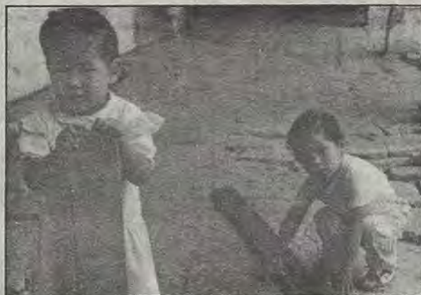
Dejarán la casa que los vio nacer