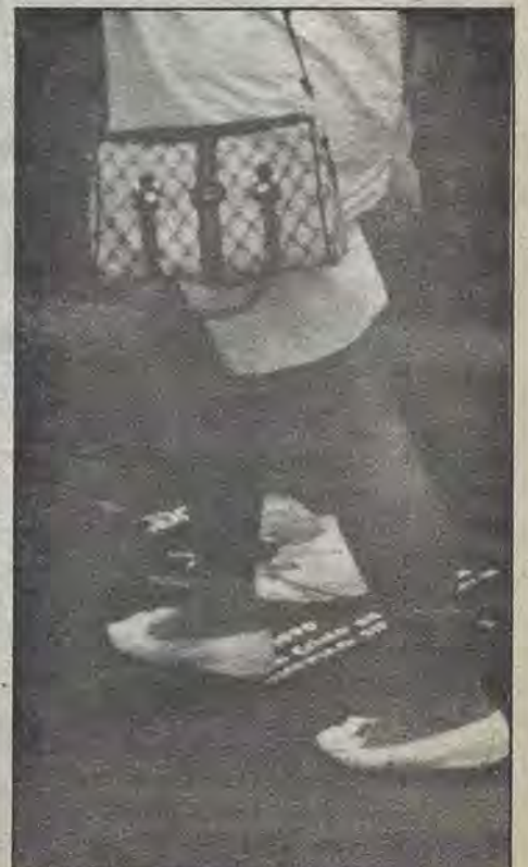
De nuevo el Papa en el Vaticano: cruda pontificia en México.