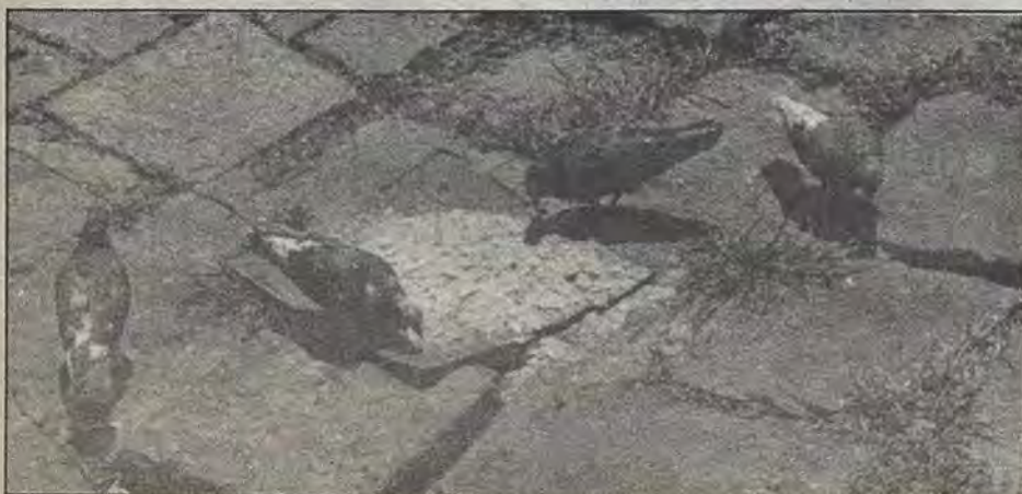
Los últimos días de los pichones

Pero, bueno -agrega con resignación- a estas horas ni para donde hacerse, pues ya mero es el 10 de junio.