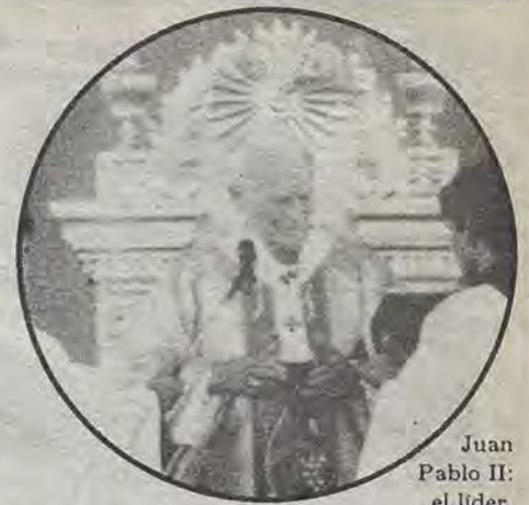
Juan Pablo II: el líder.

sociólogo queretano, hay que estar atentos para ver cómo el Episcopado mexicano traduce los mensajes papales y se moviliza. Señala, no obstante, que en el país no existe un sólo teólogo relevante -de la talla de Hans Kung, Helder Cámara o Karl Ranher- que discierna teológicamente desde la perspectiva mexicana. "Aunque, a decir verdad, desde la perspectiva de la jerarquía católica, realmente no lo necesita".