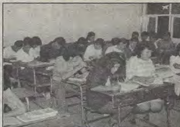
Si no hay participación, no hay oportunidad de producir y ganar más.

Por otro lado y para obtener una visión más amplia de lo que realiza actualmente el INEA, Carreño Alvarado informó que para tratar de mejorar la educación de los adultos y brindarles más atención y apoyo, en este año se instalarán cinco centros urbanos de educación permanente, en cada una de las delegaciones de Querétaro como Hércules, Santa Rosa Jáuregui, Satélite, Lomas de