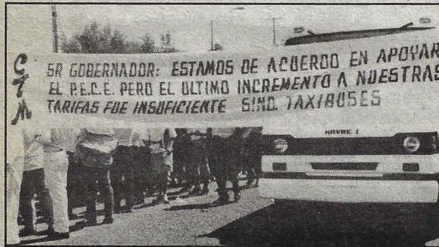
Aquel servicio amable de 1985.