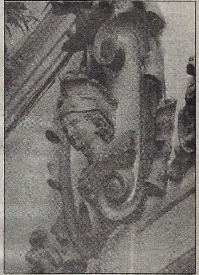
En la plenitud de la primavera de la nueva década... [Buenos días, Querétaro!]

Hombre clave en los actuales acercamientos ■ Pág. 8