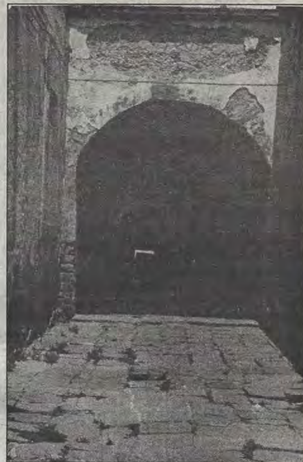
Atractivo de turistas pintores y otros artistas