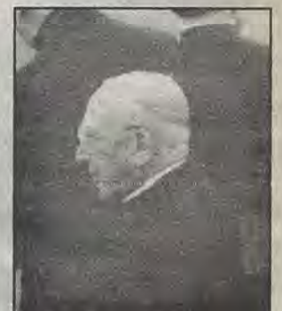
Agostino Casaroli: asuntos de Estado.