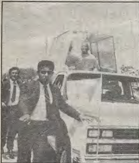
El Patriarca de Occidente y Obispo de Roma, bajo un impresionante dispositivo de seguridad: 30 mil hombres cuidaron de su vida en México.

En su actuación como asesor en los reinos del poder temporal y espiritual, el religioso e historiador nayarita, analista en varios medios de comunicación nacionales y experto en cuestiones de Iglesia y Estado, asegura que dada la complejidad del mundo de hoy "tienen que tenderse puentes de diálogo para llegar a soluciones que no están ni en uno ni en otro" ámbitos.