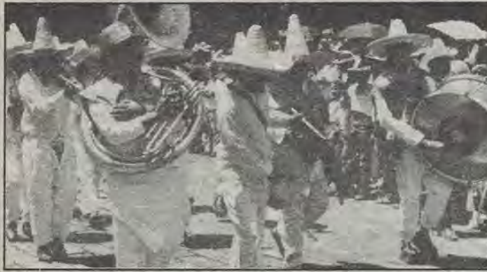
La FTEQ en dos tiempos: 1938 y 1990.