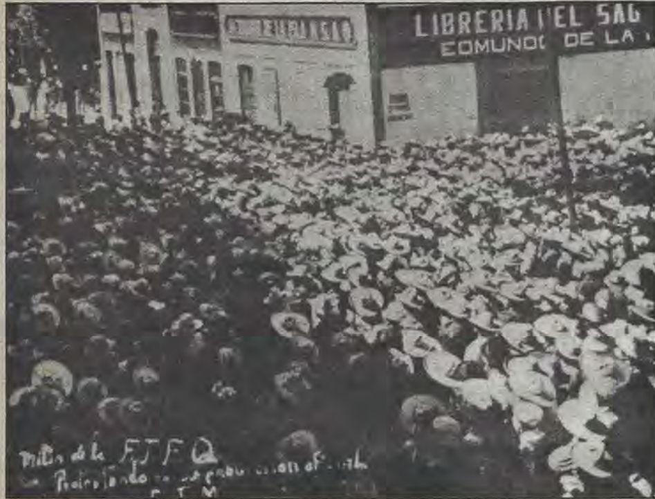
Mitin de trabajadores... en 1935

Así es, dice para concluir, porque el día que la CTM pierda sus raíces y su origen... ese día la CTM se acaba.