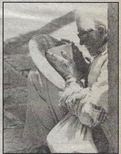
El inicio de una nueva jornada.