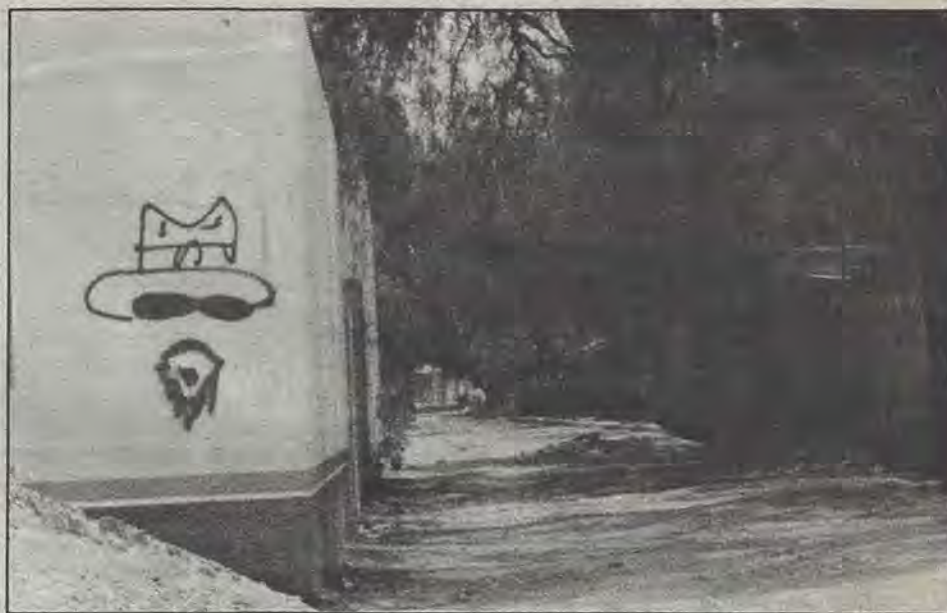
El vigilante no perdona.

En un mitin realizado en el Jardín Obregón, con ocasión del Día Internacional del Trabajo, el Partido de la Revolución Democrática (PRD) demandó mejores condiciones de vida para los trabajadores, reprobó los excesos de los líderes cetemistas para festejar el cumpleaños número 90 de su líder Fidel Velázquez, y se solidarizó con decenas de vendedores