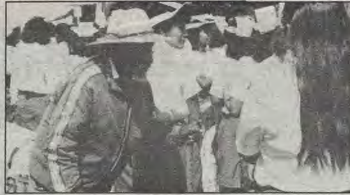
¡Solidaridad, hermanos, que estoy sin trabajo!