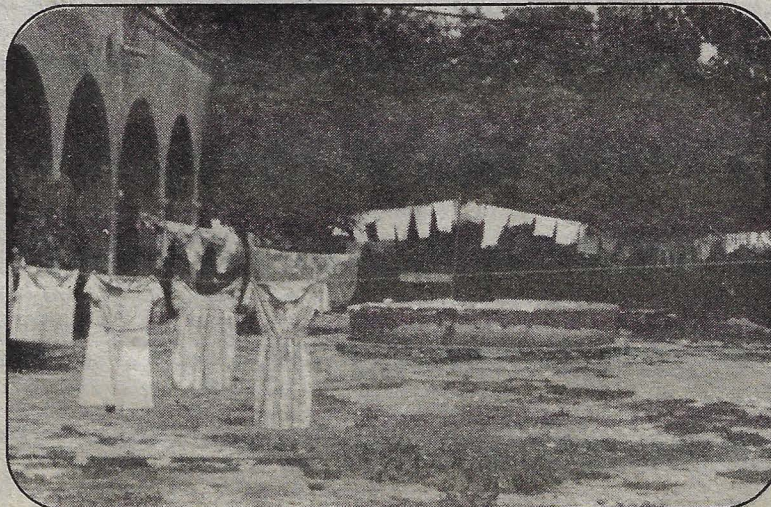
Un silencioso desalojo en Ezequiel Montes norte 29. Reportaje en la página 5.

En Querétaro 35 de cada 100 adultos en alfabetización desertan: INEA