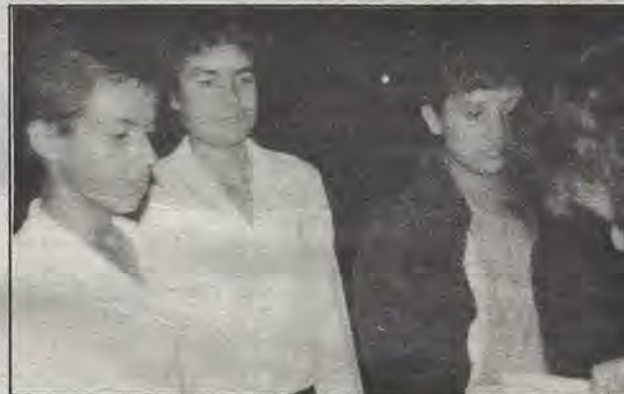
Por problemas personales, muchas veces es difícil asistir a clases, pero hacemos lo posible, porque es en bien de nosotros y nuestra familia, manifiestan estudiantes de secundaria abierta.

Casa blanca y Carrillo Puerto, además de uno que ya está trabajando en Peñuelas. En lo que se refiere al medio rural, dijo: existen desde hace más de cinco años, 80 centros de educación comunitaria repartidos en cada uno de los 18 municipios, en los cuales hay un promotor y asesores que enseñan a un grupo de adultos que desean aprender a leer, escribir o cursar la primaria, secundaria o capacitarse en actividades de tipo doméstico o de un trabajo útil.