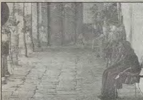
Con la restauración, hasta el recuerdo será borrado de la vetusta vecindad del agua limpia.