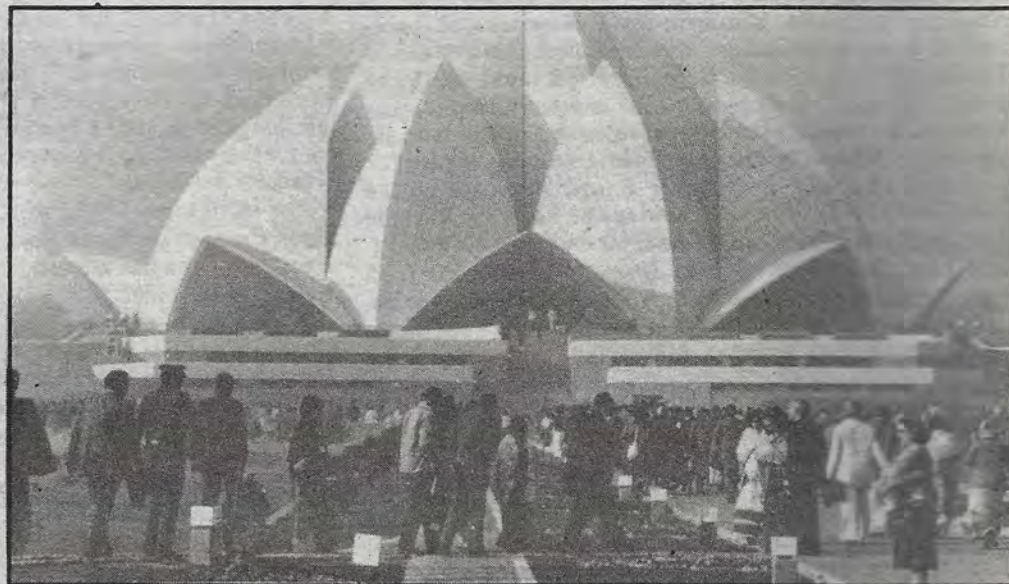
Bahapur, cerca de Nueva Delhi, India, una de las siete casas de oración Bahá'í