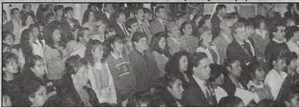
Durante la apertura de los trabajos sobre Salud Mental