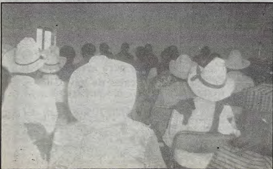
Durante la reunión de análisis del IV informe del Presidente Salinas de Gortari y el I del alcalde Rodolfo Martínez Ortiz

Durante la reunión se manifestó que "la relación política que nuestro país mantiene con nuestro vecino del norte es sumamente saludable, sobre todo en la renegociación de la deuda externa y la concertación del Tratado de Libre Comercio. Con el nuevo presidente de los Estados Unidos los tratos serán iguales, en lo que se refiere a la situación económica, vamos a competir con dos potencias comerciales y por ello, tenemos que producir más calidad y no más cantidad, procurando que los beneficios derramados abarquen a los más desprotegidos. Avalando así el compromiso de nuestro gobierno, el de gobernar y beneficiar a todos los mexicanos en general".