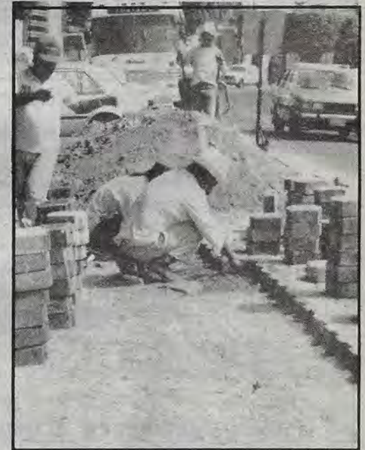
Adocreto en la Avenida Juárez