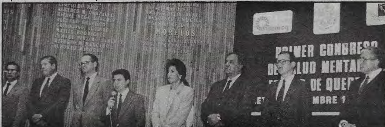
El Gobernador del estado, el Secretario de Gobierno, el Alcalde de la capital y la Presidenta del Tribunal Superior de Justicia durante la apertura del primer Congreso de Salud Mental

Cuestionado por la prensa local en torno, también, a la próxima sucesión presidencial, Burgos García, negó que las elecciones del 94 vayan a generar violencia, porque "por fortuna al paso de estos hechos salió la opinión, y la opinión pública es la que aportaron los partidos políticos, quienes salieron al paso condenando y cuestionando ese tipo de actividades, por eso no creo que deba repetirse". Sin embargo, agregó "no solamente consiste en buenos deseos, debe haber reglas muy claras, transparencia en los procesos y compromiso político.