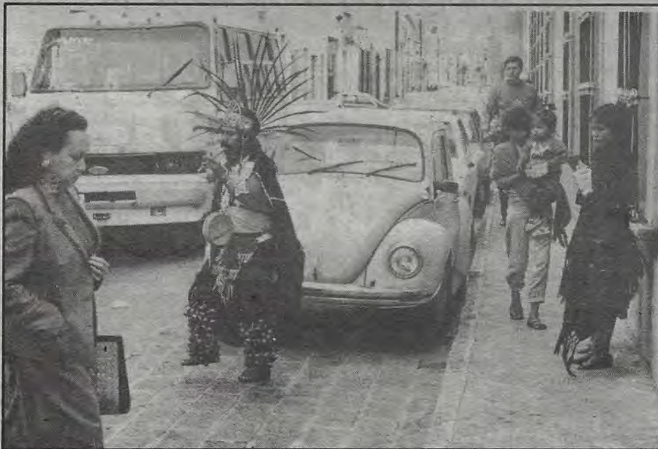
En el correr del año 501 del encontronazo.

+ "Explorar abiertamente" esa relación para comprender el fenómeno de la criminalidad, plantea el director de la Facultad de Sociología + Un tercio de la población mexicana, víctima de enfermedades mentales, afirma el Presidente de la Federación Mexicana de Sociedades Pro Salud Mental + Mala alimentación, entre las causas más graves + Cada año, 3 millones de infantes no desarrollan plenamente su cerebro debido a la desnutrición + 400 millones de esquizofrénicos en el mundo + 150 millones con trastornos de neurosis severa, señala el doctor Ramón de la Fuente Muñiz