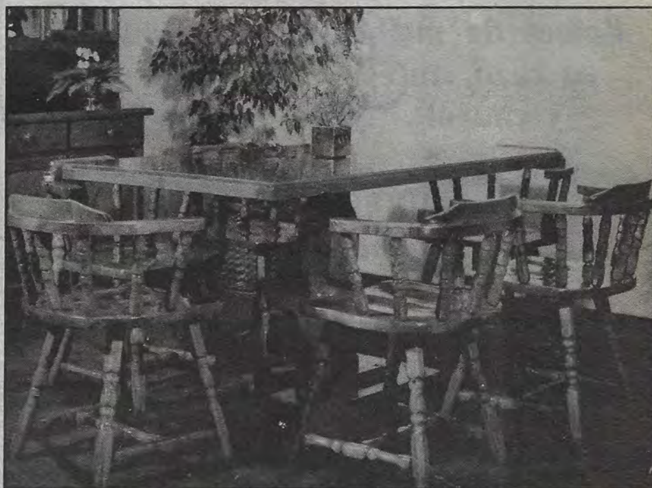
Oferta: comedor Virginia, en pino sólido de 4'250,000 a 3'750,000