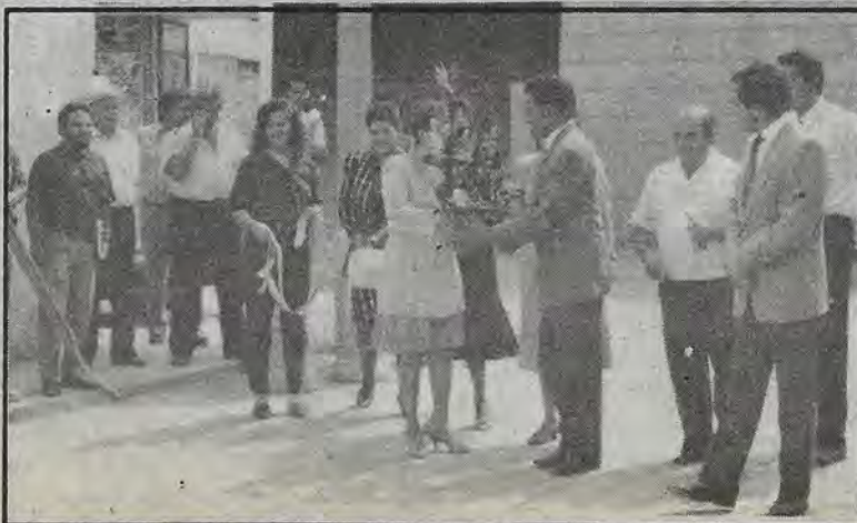
El presidente Salvador Olvera, durante la inauguración de la obra.

El color del adocreto es el autorizado por el Instituto Nacional de Antropología e Historia (INAH), por ir acorde a los colores tradicionales de San Juan del Río.