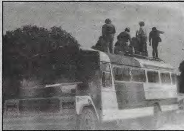
En estas condiciones son transportados los trabajadores del municipio

Al tiempo, Tránsito del Estado arremetió contra la asociación civil y mediante acoso policiaco e infracciones continuas de hasta 300 mil pesos fue sacandola del servicio. "Esto fue gracias a que Tránsito -cuyo titular es Enrique