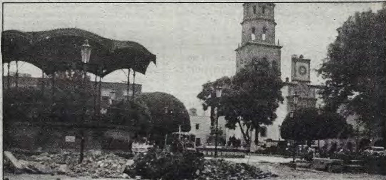
Trabajos en el Jardín Obregón