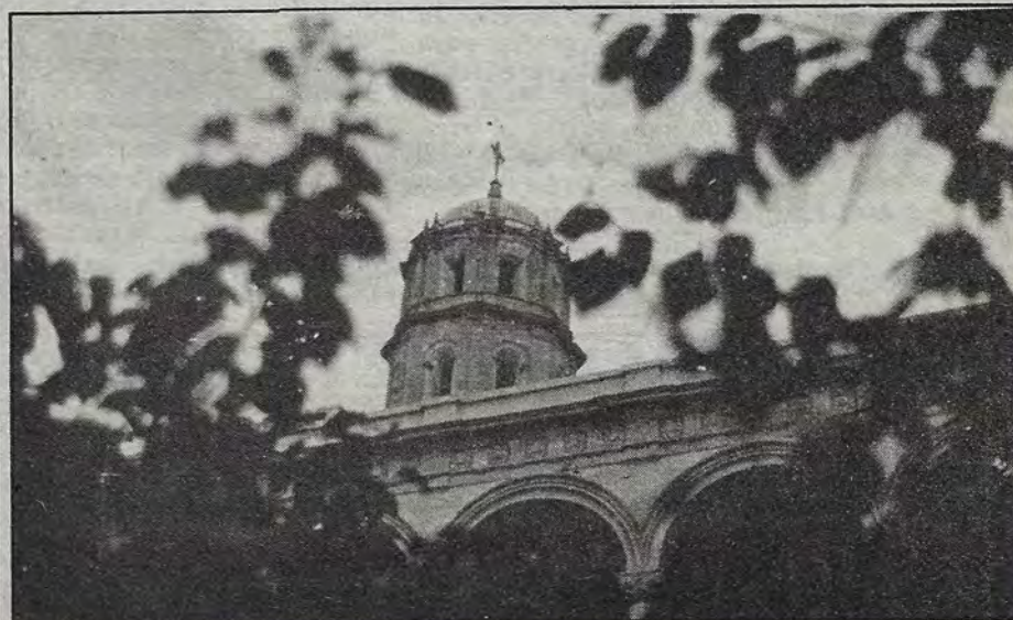
Eje y motor de la vida de Querétaro desde sus orígenes, primera y única parroquia entre 1582 y 1759; primera catedral entre 1865 y 1911 y cabecera de la Provincia de San Pedro y San Pablo entre 1630 y 1920, San Francisco está sobre la mesa de la discusión. (Foto de Omar Ontiveros).