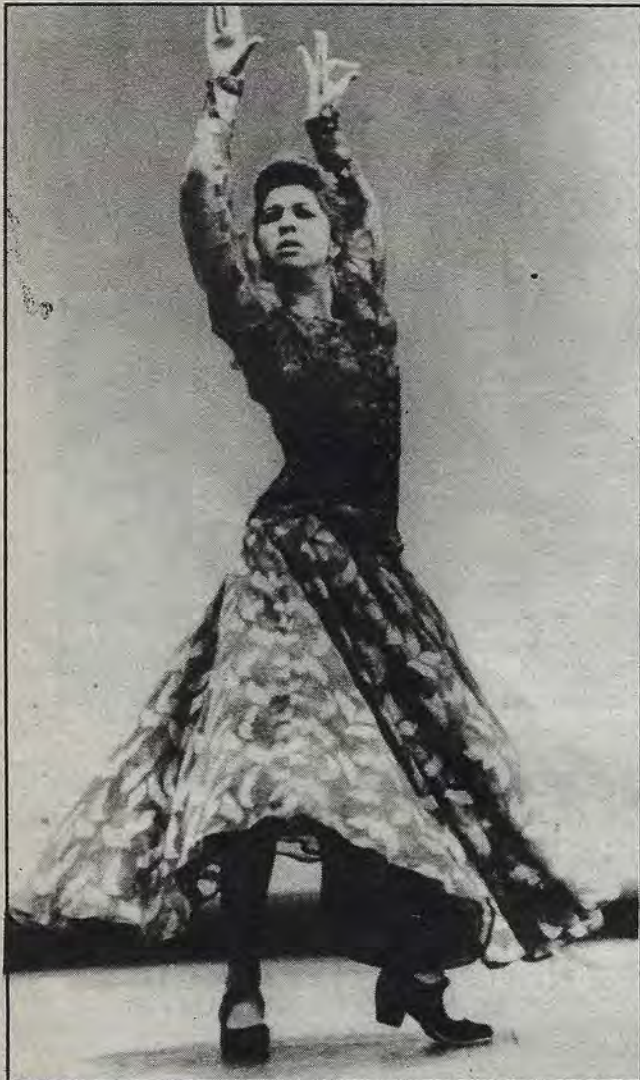
En septiembre se presenta en esta ciudad Cumbre Flamenca "El Baile". Esté pendiente.

FUENTE: Tomado de EL HERCULES, periódico del mismo sindicato, núm.100,1941,p.6.