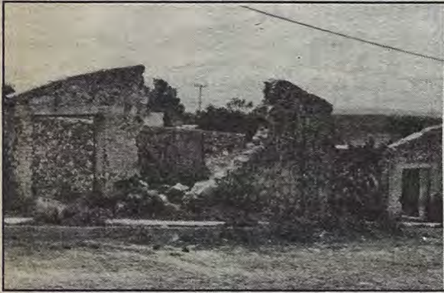
Calle de Norberto Aguirre. Ruinas