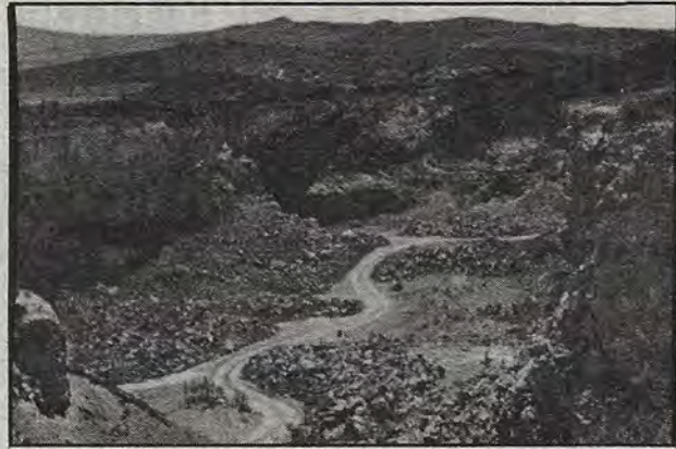
Quebradora Macoide. Peligros y descontento