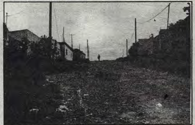
Calles sin nombres, banquetas, ni empedrados

Sin embargo los vecinos que se encuentran en las inmediaciones de la colonia insisten "acá nos tienen relegados, de lo unico que no nos podemos quejar es del aire limpio que respiramos".