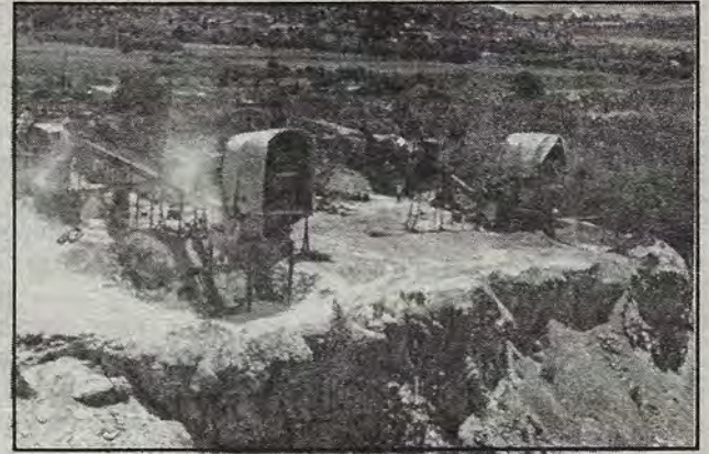
Problemas de años, aun sin solución