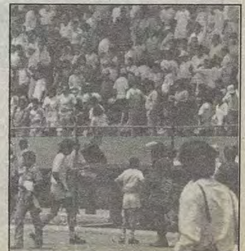
La afición tendrá que exigir un mejor cuadro.