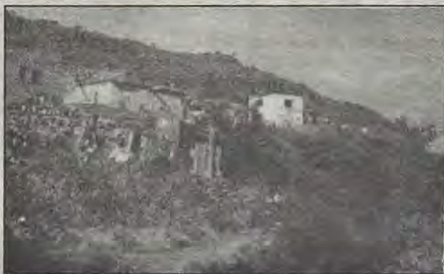
Vivienda: alternativas populares.

Durango fue la primera entidad donde el Comité de Defensa Popular, tras su participación electoral, obtuvo cargos públicos: algunas diputaciones