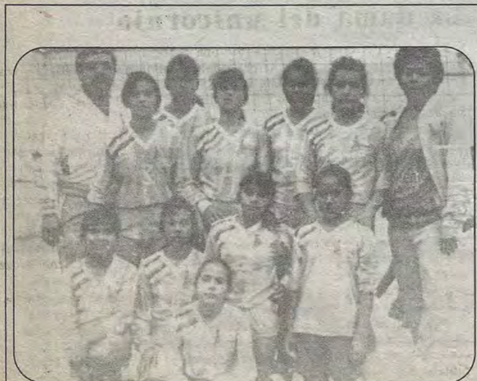
El equipo representativo de Querétaro en el Encuentro Nacional Estudiantil, en la rama femenil infantil de volibol, realizado en la ciudad de Toluca, puso en alto el nombre de nuestro estado al obtener el primer lugar. ¡FELICIDADES!