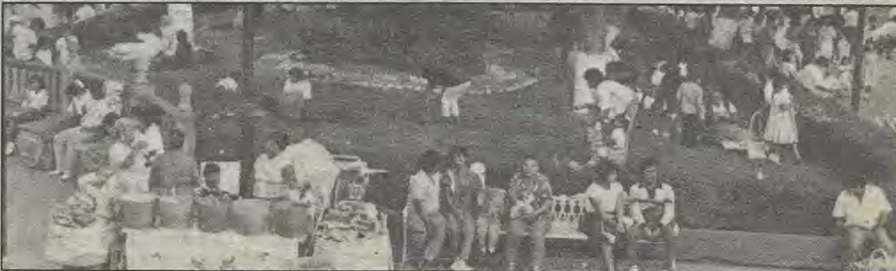
Domingo de plaza en el Jardín Obregón. A falta de alamedas libres, el pasto del antiguo Zenea, que pronto será sometido a remodelación.