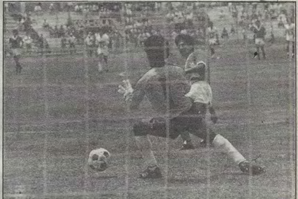
La puntilla para los "cementeros". (Fotos de Jesús Ontiveros).