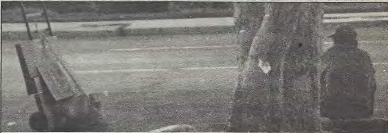
La carga puede esperar.