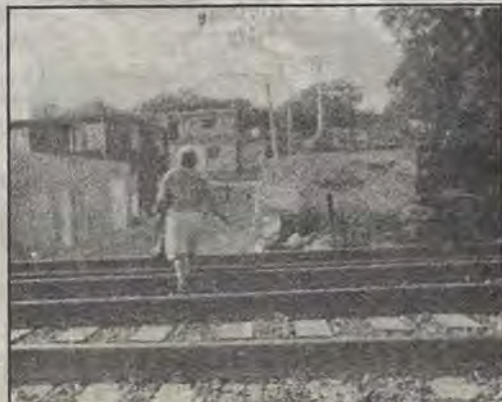
Para una colonia donde la población infantil es numerosa, la cercanía de la vía del tren representa un serio peligro.

"En su momento yo hablaré y haré las declaraciones que considere convenientes. Yo creo que cuando no debes nada estás igual de tranquila y cuando tienes principios no hay ningún problema. ¿Pagos a la prensa? No quiero decir nada, no deseo hacer ninguna declaración, quiero callarme todo".