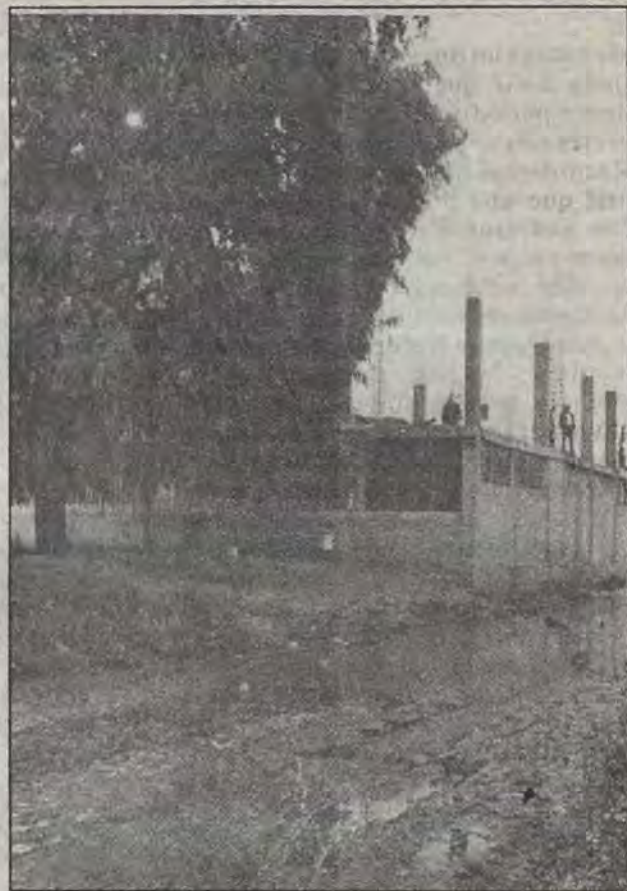
Al fondo, las instalaciones de la preparatoria "J. Guadalupe Ramírez Álvarez", de donde algunos juniors arrancan sus coches y pasan "como el vil diablo".

"Y la misma promesa solemne -continúa- nos la repitieron hace apenas dos semanas en Obras Públicas. Por todos lados le hemos movido. Es más hasta les llamamos al teléfono que anunciaron por