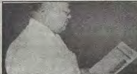
Florencio Olvera Ochoa, Vicario General de la diócesis de Querétaro.