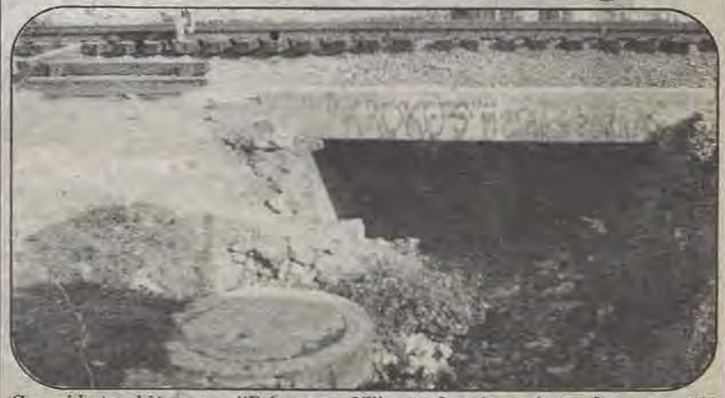
Conocido también como "Primavera 87", este fraccionamiento de escasas 100 viviendas ubicado en San Sebastián, se debate entre la basura y los lodazales. Reportaje en la página 5.