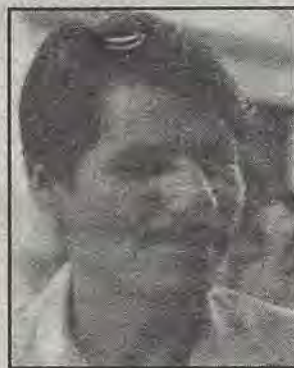
Eduardo Reséndiz Mendoza

político mexicano. El sistema nos ha hecho mucho daño y ahí tenemos que 20 millones de mexicanos no creen y prefieren no votar. Nosotros queremos hacer énfasis entre la gente en que la política no es nada sucio o negativo, sino algo sano y necesario".