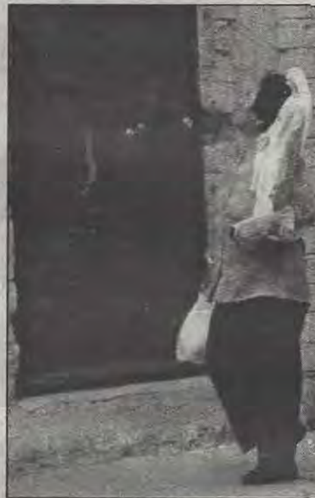
Con la mirada al cielo y cargando por el mundo la devoción.