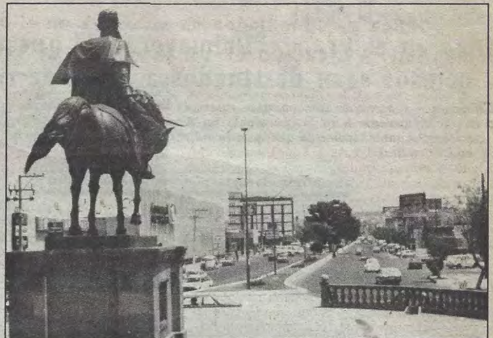
Zaragoza, desde el monumento a Escobedo