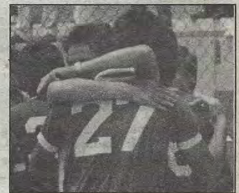
La victoria leonesa.

la misma historia, jornada tras jornada, o de plano abandonar el nombre, que es lo único que siguen.