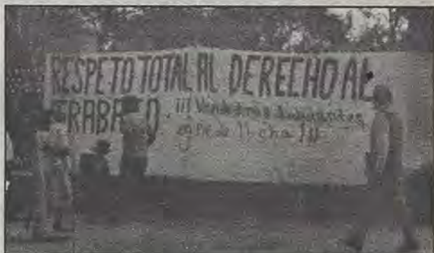
En la Alameda Hidalgo.