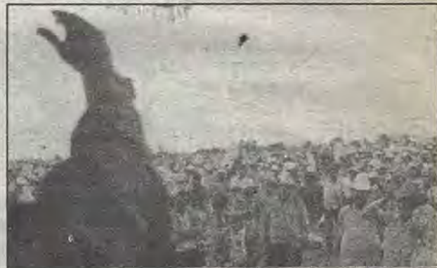
Una arenga durante la marcha guadalupana al Tepeyac.