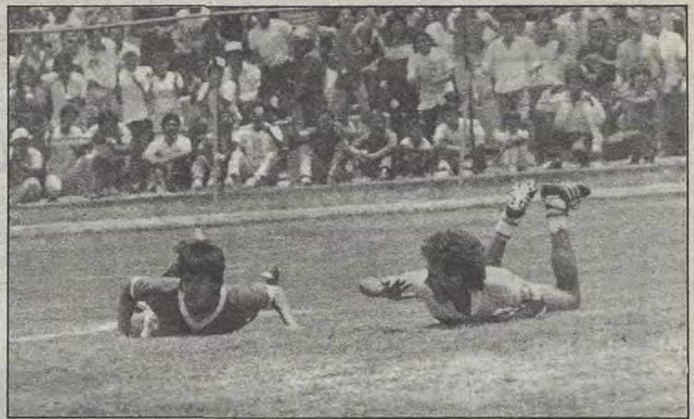
¡Vaya manera de luchar por el esférico!