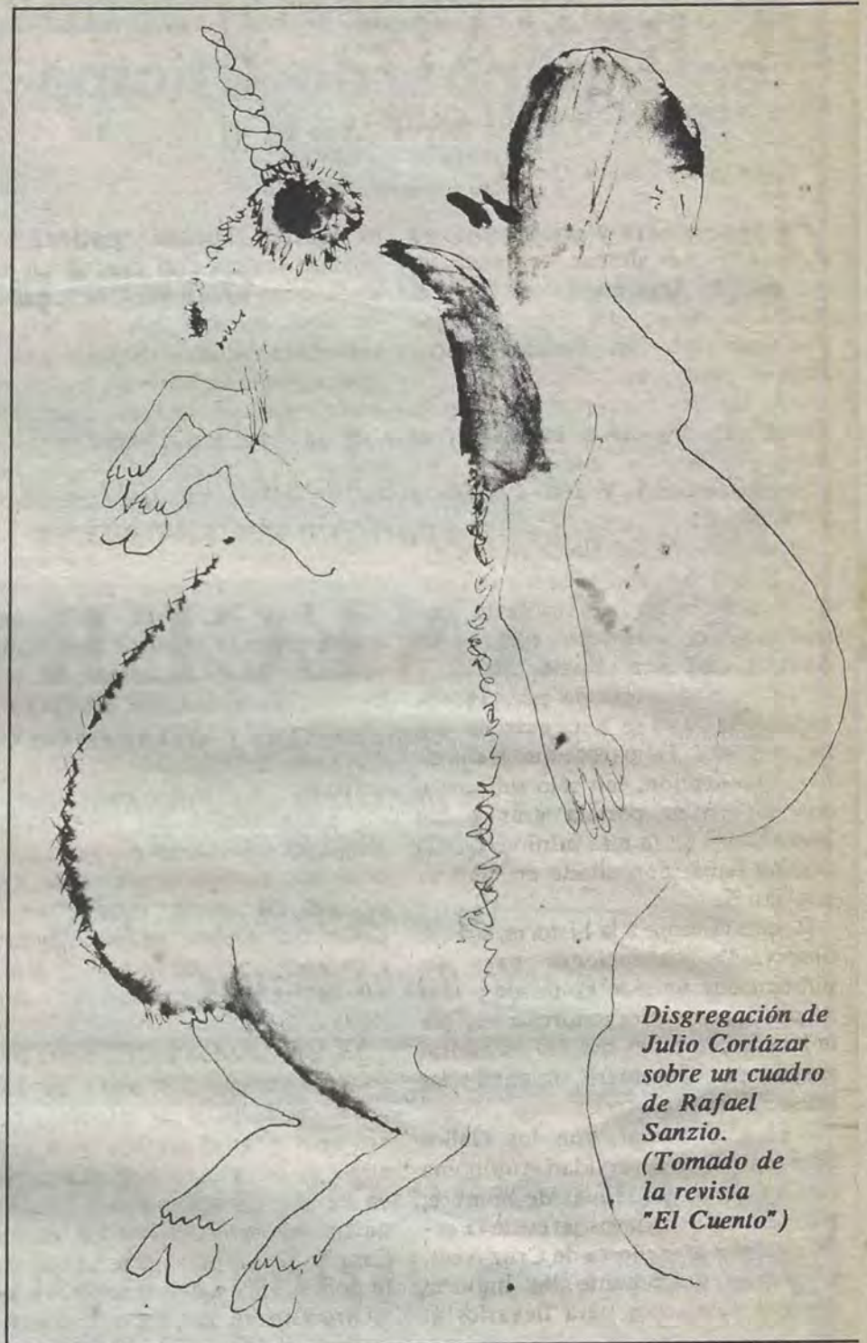
Disgregación de Julio Cortázar sobre un cuadro de Rafael Sanzio. (Tomado de la revista "El Cuento")