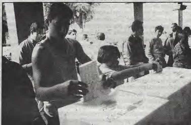
Durante la jornada electoral del 21 de agosto en la cabecera municipal de Corregidora.

—No podemos hablar de una elección imparcial cuando el 98 por ciento de los funcionarios elec-