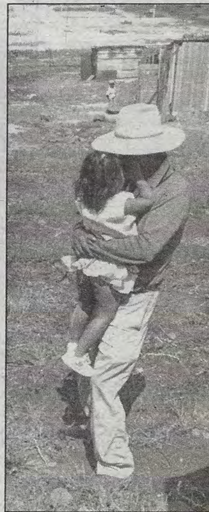
Ejidatarios de San Pedrito el Alto se niegan a desocupar terrenos donde el gobierno del estado pretende urbanizar para construir viviendas. En una reunión con funcionarios de la Reforma Agraria y de la Comevi, los campesinos insistieron en exigir se les reconozcan sus derechos sobre ese suelo desde hace más de tres décadas.