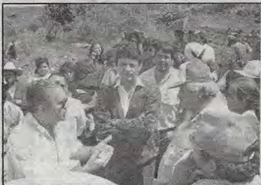
Funcionarios y ejidatarios. No hay acuerdo.