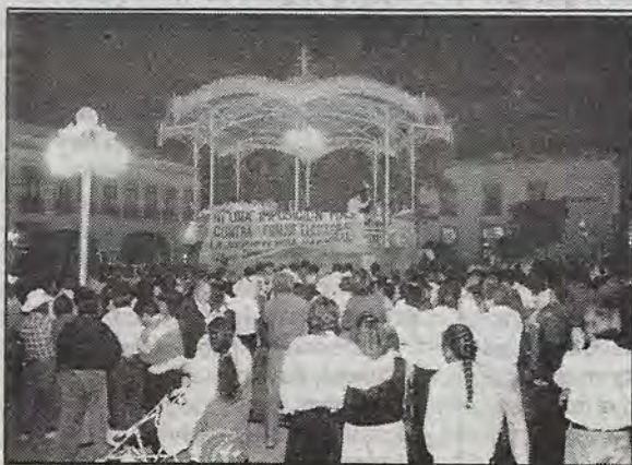
Jardín Zenea, 26 de agosto.