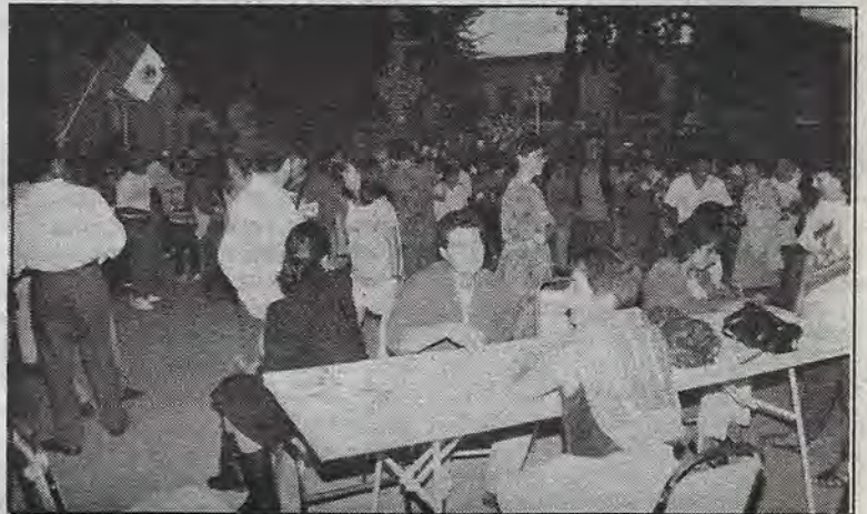
Durante las protestas poselectorales en la ciudad de Querétaro.