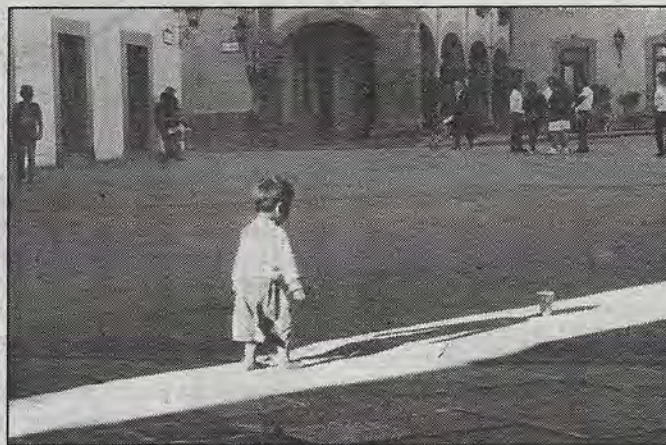
Solo, buscando su realidad.

Se trata entonces de crear clientes en potencia, de preferencia que no pongan en