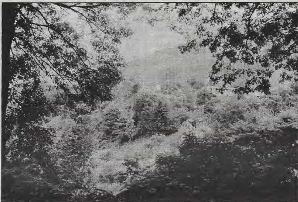
Aguascalientes, Chiapas, agosto de 1994.

La raza se alborotó. La voz de Marcos es seria, grave, no está jugando. Quien crea que está chaceando está en un error.