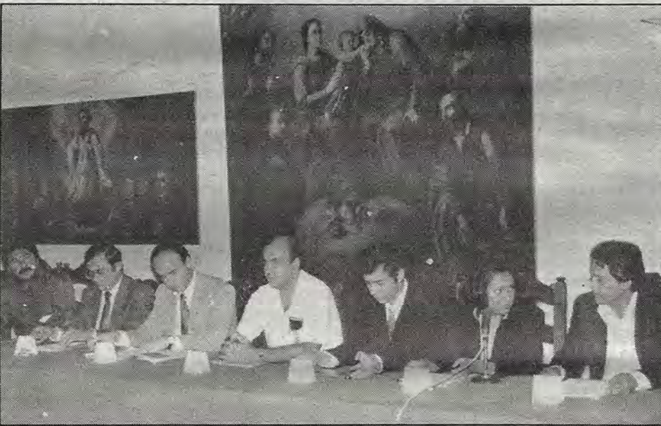
Durante la presentación de la revista Debarrocorazón .

Este texto forma parte de la exposición hecha durante la presentación de la revista Debarrocorazón , el martes 20 de septiembre, que dirige el autor.