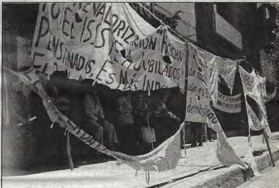
Oídos sordos ante las demandas.

Y concluye: "A como estamos viendo esto, va para largo, para muy largo porque nos traen engaño tras engaño y así no va mejorar nada, que podems esperar después de tantos años de servicio, ¿esto?"