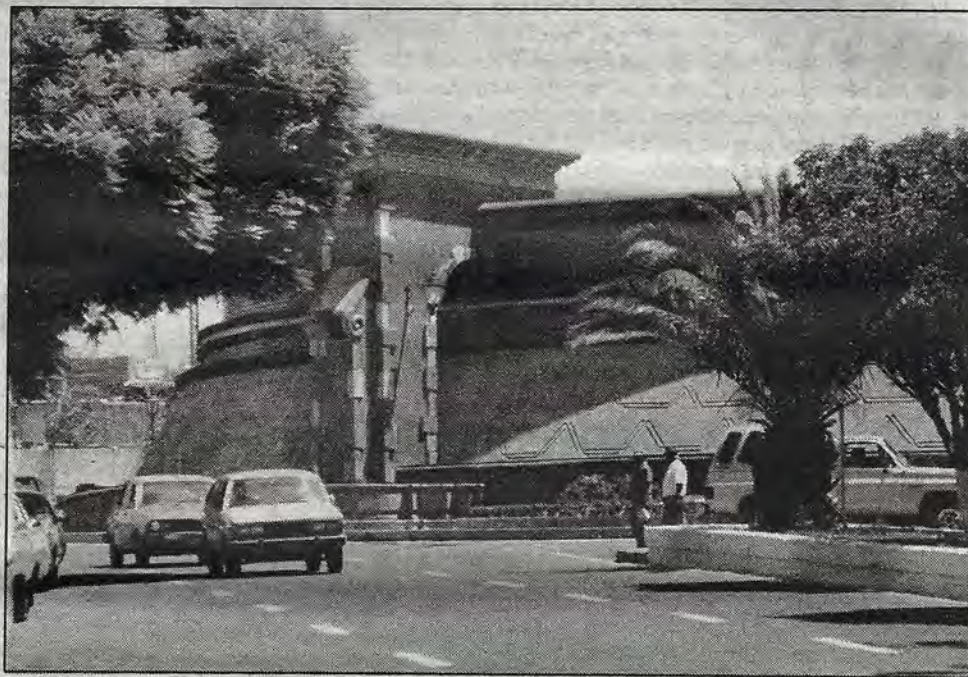
Detalle faraónico de la flamante fuente de El Marqués, el otrora popular "tanque" de La Cruz.

Algunos profesionales de la Salud y la Educación se "sacan de onda" cuando una persona reclama sus derechos como persona antes que como "enfermo" o portador de algo que lo hace diferente, pero es una buena llamada de atención para que se revise lo que se ha estado haciendo y los resultados de eso. Sólo de esa manera podremos seguir trabajando en conjunto: la persona que viene a buscar alguien que escuche y la persona que sirve como acompañante. La mayoría de las veces, sea Terapia, Orientación o Educación, estamos en el terreno de la re-educación. Y estamos dos personas (o más).