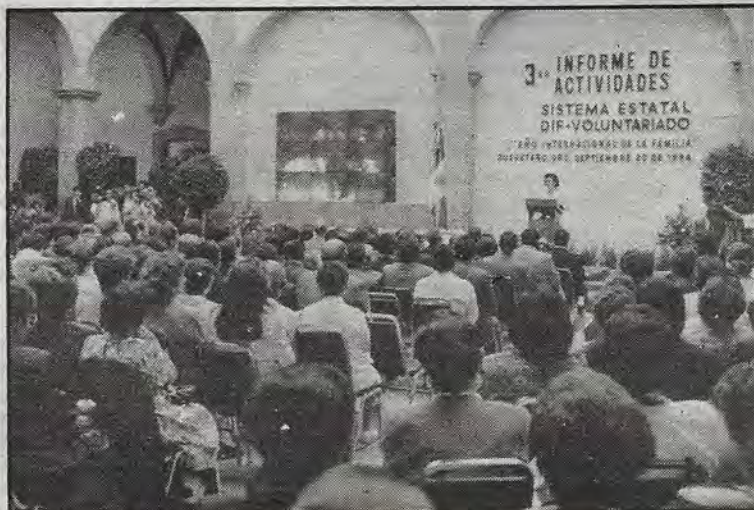
En el Palacio de Conin.

Luego de reconocer que este panorama de retos y posibilidades nos obliga a redoblar los esfuerzos y "a dar prioridad a nuestras acciones", la presidenta del Sistema Estatal DIF-Voluntariado, precisa que "los próximos años consolidaremos la infraestructura de los servicios de asistencia social en todo el estado, reforzaremos los programas con características de promoción y desarrollo especialmente los destinados a atender el medio rural con el fin de poder aliviar de una manera más permanente las carencias de la población marginada". Insistiremos -enfatisa-, en incrementar la participación de la sociedad para que esta