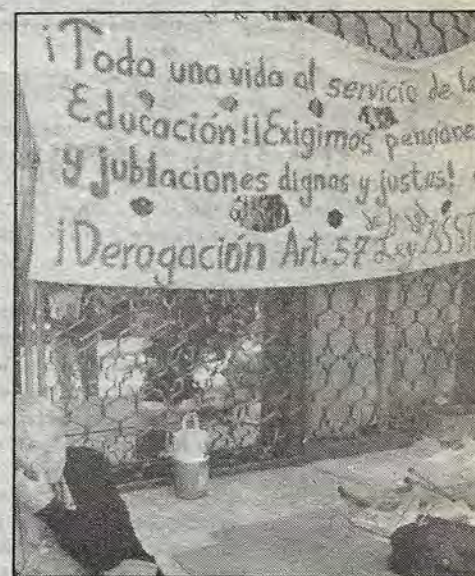
Sobre la Avenida Corregidora.

ahí por lo menos la voy sobre llevando, tengo siete hijos, cuatro maestros, dos ingenieros y uno que le ha dado por la música, ellos me ayudan hay cuando pueden pero la realidad es que en la actualidad no tenemos mucha ayuda de los hijos".