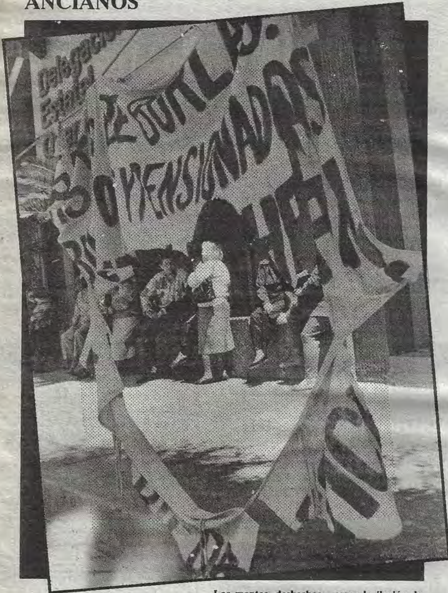
Las mantas, deshechas... como la ilusión de justicia.