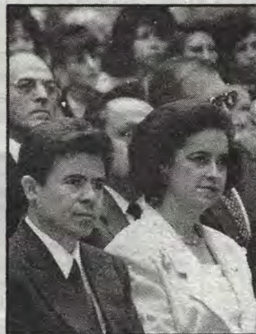
El gobernador de Querétaro y la esposa del presidente de la República.

co de Salud mental; tener nuestra Casa del Adolescente; iniciar la construcción del Albergue del Menor Desprotegido; implementar el programa de Desarrollo Integral de la Familia Rural; apoyar las microindustrias; iniciar el Voluntariado Cultural y crear el Centro de Capacitación para la Mujer Campesina".