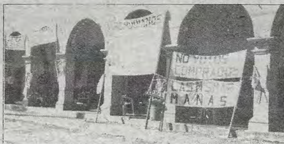
Un mes ya.

De esta manera el presidente municipal manifestó que el está en desacuerdo porque las obras tiene que hacerlas la gente de aquí