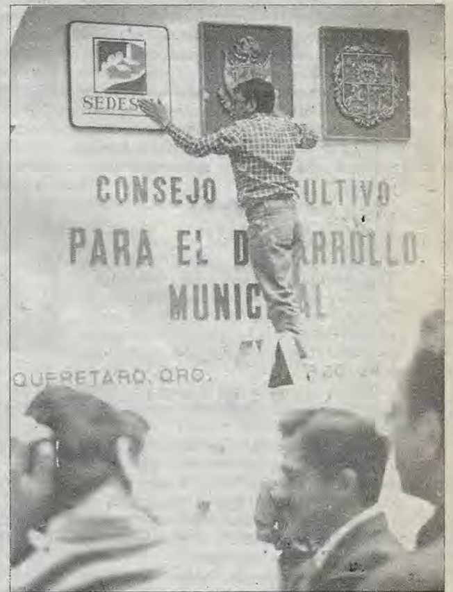
Poco antes de la llegada del titular de la Secretaría de Desarrollo Social.