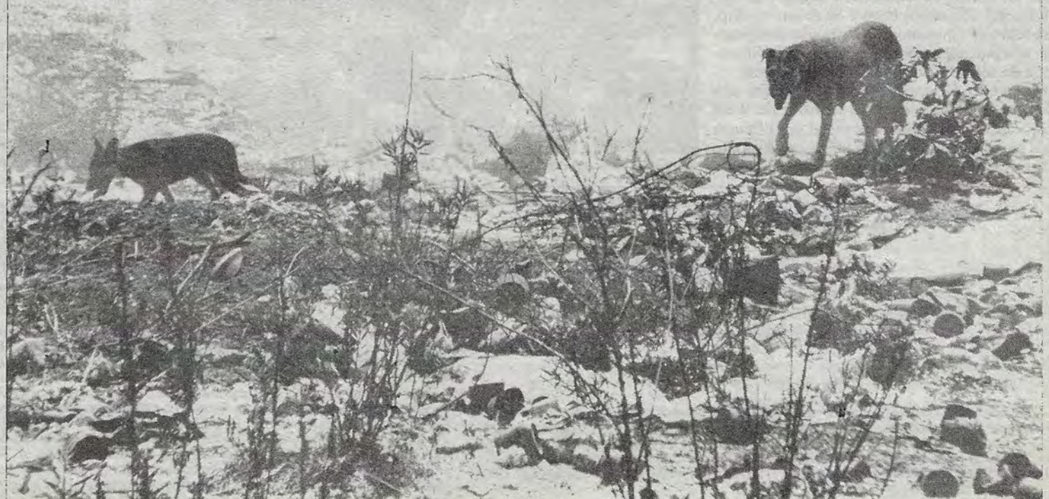
¿Cortina de humo? ¿Los demonios que andan sueltos? ¿La perra hambre?...