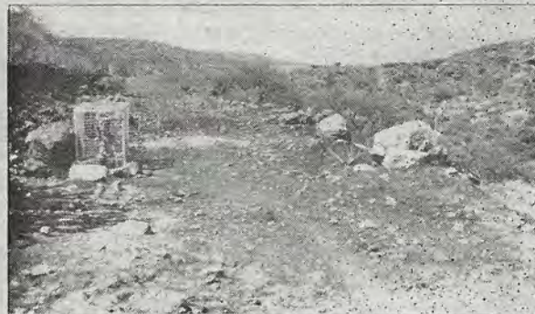
La brecha que abrió la CEA. A la izquierda se observa un "respiradero" de la línea hidráulica.