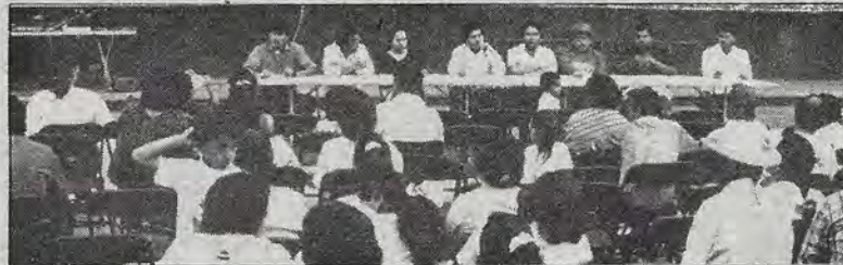
Durante el Foro sobre los proyectos sociales frente a la crisis: Hacia un modelo alternativo.