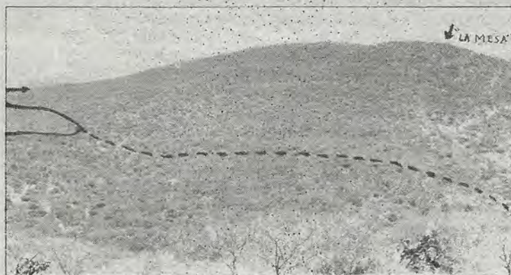
La línea punteada indica la ruta que sugieren los ejidatarios para el camino hasta La Mesa. A la izquierda aparece señalada la brecha existente.

presentó otra persona, de apellido Franco, que se ostentó como "coordinador de asuntos agrarios del gobierno" y sin documento que avalara sus palabras pretendió convencer a los ejidatarios de que permitieran la apertura del camino, porque "se trata de una obra de gobierno" y que "a cambio nos darían una concesión para un taxibús" que daría servicio de San José el Alto a La Mesa. También les ofreció arreglar el camino que une a éstos dos lugares (2 kms), pero tampoco la propuesta fue aceptada.