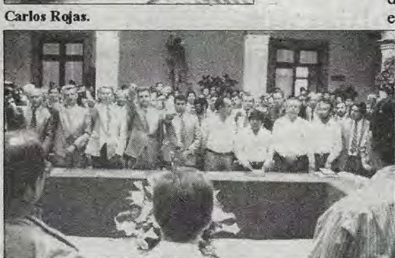
Durante la toma de protesta a los integrantes del Consejo Consultivo para el Desarrollo Municipal de Querétaro.

"Todo lo que trasciende es producto de un ejercicio colectivo, fundamentalmente de una sociedad que advirtió la significación de un esfuerzo de este alcance, en el que se trata un problema de la mayor importancia, como lo es la atención especializada al niño quemado".