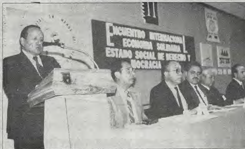
Durante la apertura del II Encuentro Internacional de Economía Solidaria.

En tanto durante la inauguración de este evento que concluyó el viernes, el rector de la Universidad Autónoma de