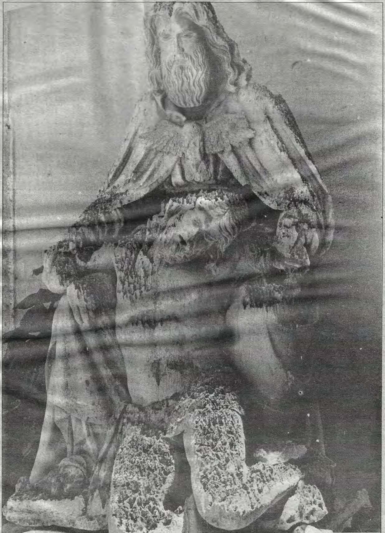
Dios perdona... pero el tiempo no olvida.

+ Enfrenta la Universidad dos revisiones salariales en plena insolvencia: el pago de la prima vacacional, primer compromiso incumplido + Protesta el SUPAUQ: esta medida empantana las negociaciones y pone en duda la estructura jurídica que sustenta las relaciones de trabajo, dice + El rector advierte que los márgenes presupuestales están "fuertemente limitados" + Llama a la unidad y a la comprensión + El 84% del presupuesto general de la Universidad proviene de subsidios del gobierno + 78 de cada 100 pesos del presupuesto, se destinan a pago de salarios y prestaciones + Revisiones de salario: los maestros demandan 20%; los empleados 42%