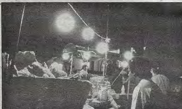
Durante una concentración convocada por el Partido de la Revolución Democrática, el lunes 10 de abril, para conmemorar un aniversario más de la traición de Chinameca, donde perdió la vida el insurgente Emiliano Zapata.