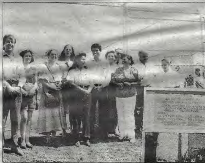
En la instalación del segundo centro de acopio en Tejada.

Hoy está en Guadalajara y en Puebla, ayer en Ciudad Juárez y Tijuana, mañana en Matamoros y en Acapulco, pasado mañana en Nuevo Laredo y en el puerto de Veracruz; antes de ayer en alguna parte de Belice o en ruta para Nueva York.