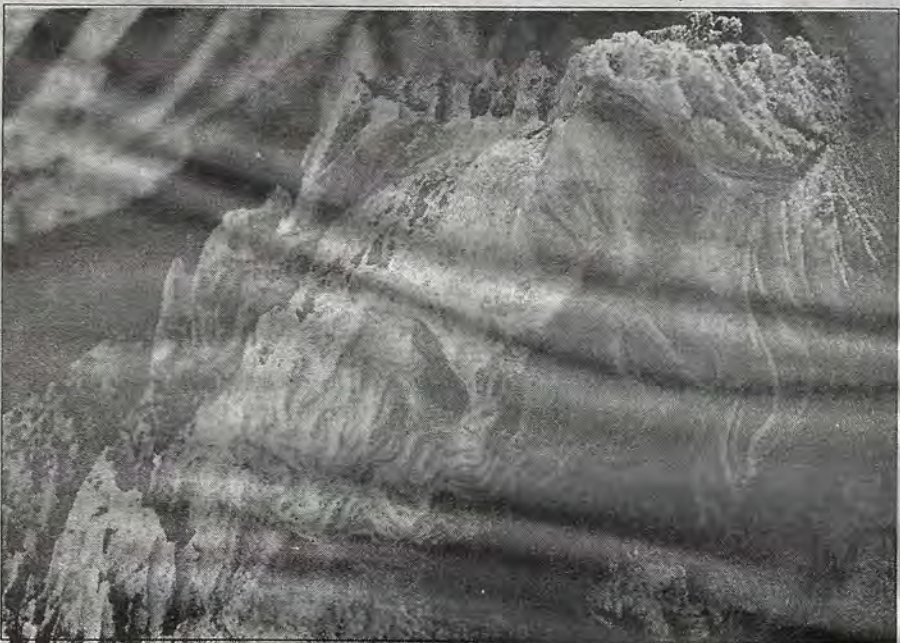
Imagen que representa a la Santísima Trinidad. Se encuentra en los patios del templo parroquial de Santa Ana de Querétaro.