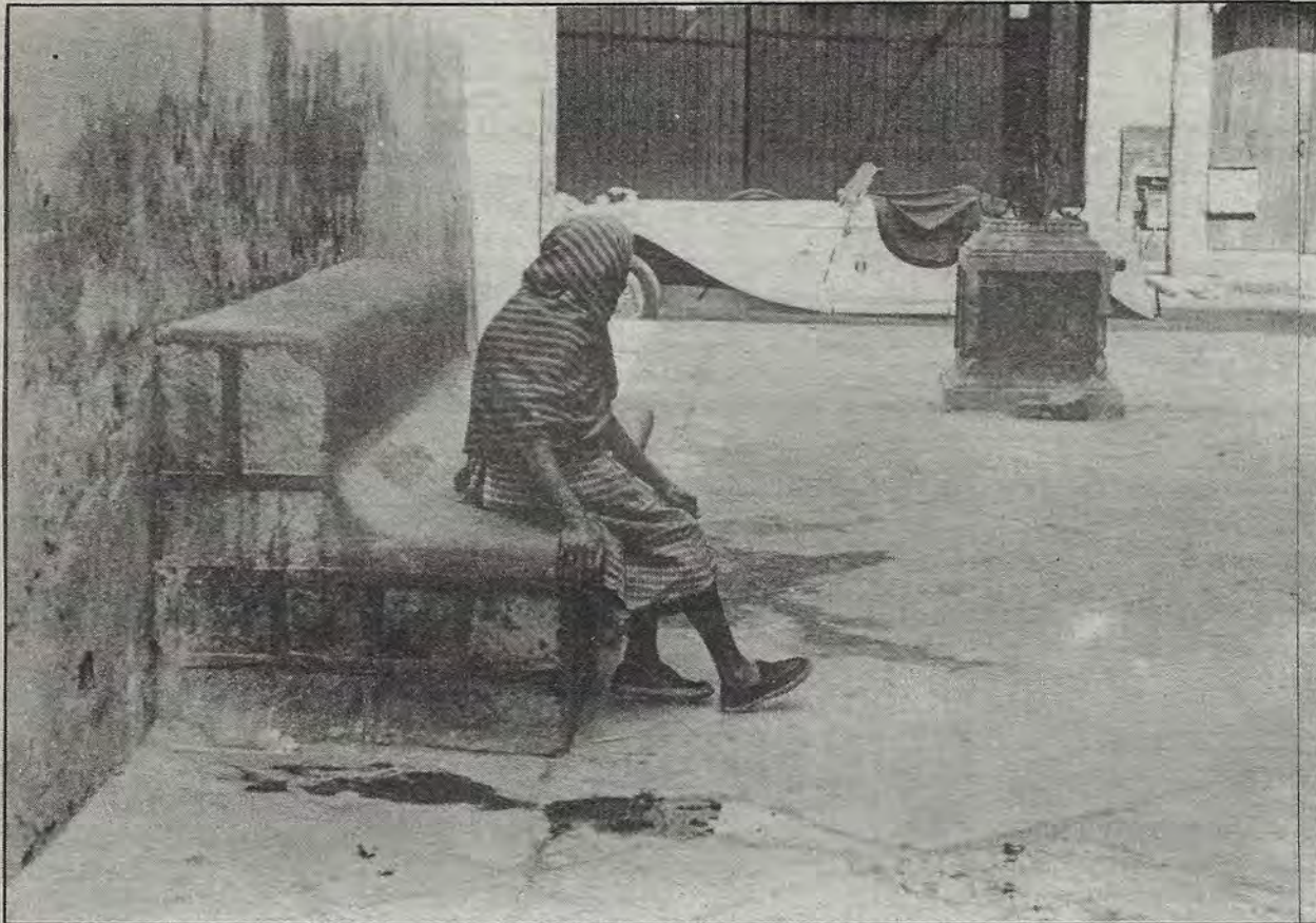
¿Un espejismo...? O la ilusión de pasar de la miseria al Primer Mundo.