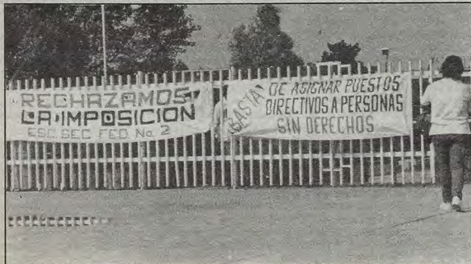
La protesta en la Secundaria 2.