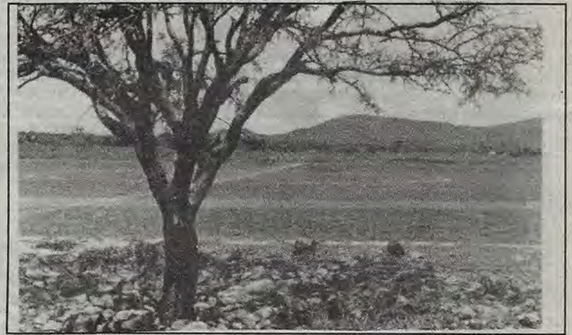
Las tierras en litigio.

La Universidad del futuro debe apuntar a sus tendencias más libertarias y por lo tanto más políticas. Tendrá para ello que empezar por democratizar sus propios procesos tanto académicos como políticos y no aferrarse a prácticas obsoletas de control que, paradójicamente, entre más efectivas más la hundan en la mediocridad. La miopía de quienes las utilizan les hacen caer en actitudes triunfalistas que ciertamente se justifican en la inmediatez de sus logros (como el mantenimiento del poder personal o de grupo) pero que colocando a la Universidad a contracorriente del movimiento de democratización que exige la sociedad civil contribuyen a su deslegitimación y debilitamiento.