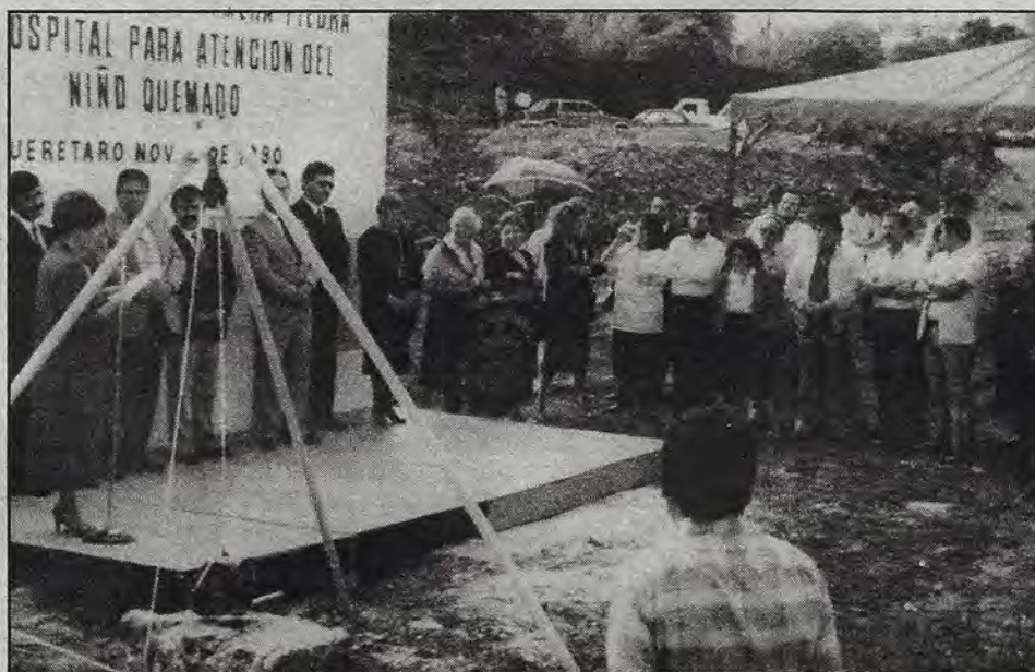
Durante la colocación de la primera piedra.

Adeinauguró recientemente la exposición "Revolución Mexicana, síntesis de nuestra identidad nacional, que se presenta durante estos días en la Sala de la Revolución Mexicana del Museo Regional.