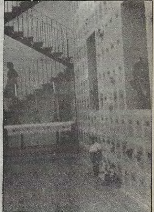
Unos van, otros vienen. Flores y candeleros, criptas y ruegos. Un remanso surrealista, rincón de eternidad. Ahí, en San Felipe Neri.