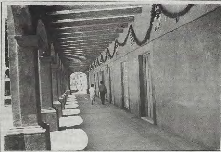
¡Ya pagarán otros..!