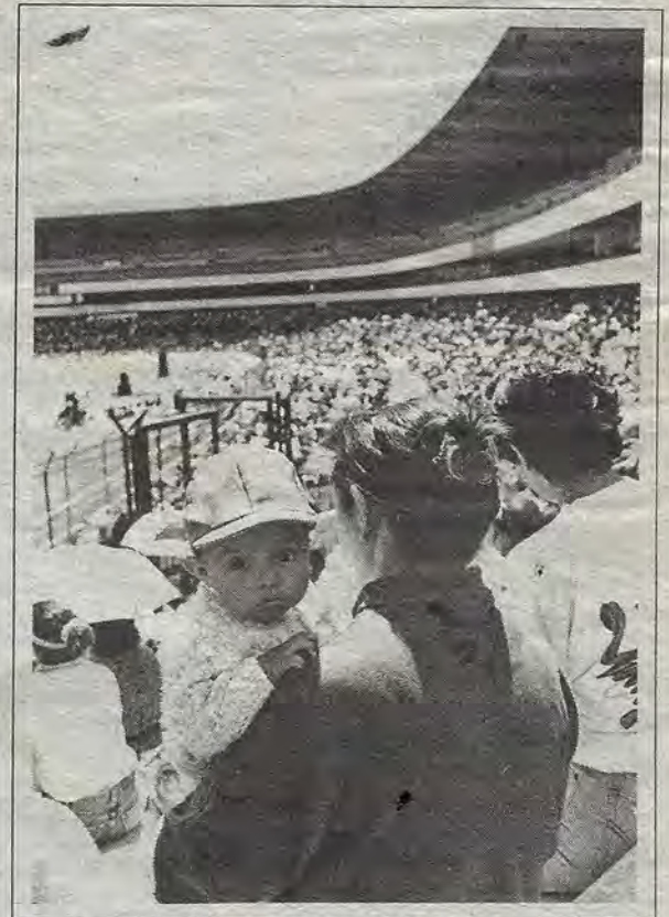
"Por la familia".