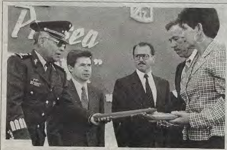
Entrega de la presea "Damián Carmona posmortem" al piloto que falleció al chocar cuatro aviones militares durante el desfile del 16 de septiembre pasado en la capital del país.

Aquí mismo en Querétaro le recuerdan varios académicos que lo conocieron durante los coloquios de la Sierra Gorda.