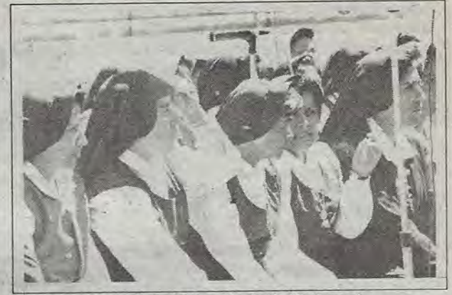
Junto al altar móvil.

Unos 8 mil católicos--entre los que destacó la presencia de religiosas y estudiantes de colegios privados-- participaron, el domingo 18 de octubre, en una peregrinación que partió de la explanada del auditorio Josefina Ortiz de Domínguez y culminó con una misa en el estadio Corregidora. La movilización tuvo como objetivo manifestar oposición a presuntos acuerdos suscritos por México en la IV Conferencia Mundial sobre la Mujer.