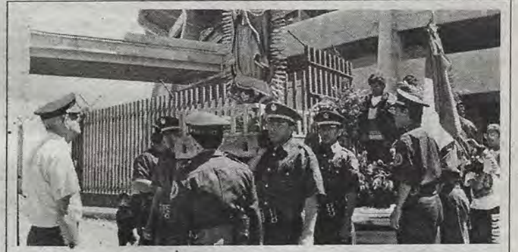
Los hombres, portadores de los símbolos de la mexicanidad.

La Iglesia, añadió el vocero diocesano, ha recomendado el método natural de Ovulación o cierto control natal con relación al período que tiene la mujer, así que rechaza toda violencia causante de 'pequeños abortos' o método artificial. En cuanto a eso de los jóvenes sabemos que todo lo que no es desordenado es correcto, el sexo es maravilloso y por eso Dios lo dió al hombre y a la mujer. Dios es bien aguzado, dió el atractivo del sexo para que el hombre y la mujer se comprometan, pero tener hijos sin matrimonio y sin responsabilidad no es correcto; manejar el instinto sexual separando el placer de la funcionalidad es egoísmo, como lo son las desorientaciones del sexo de hombre con hombre y mujer con mujer. La Iglesia recomienda que se use el sexo a su debido tiempo, en el marco de la familia, que es cien por ciento educativa, y por consiguiente que se elimine lo que significa el abuso o el mal uso del sexo".