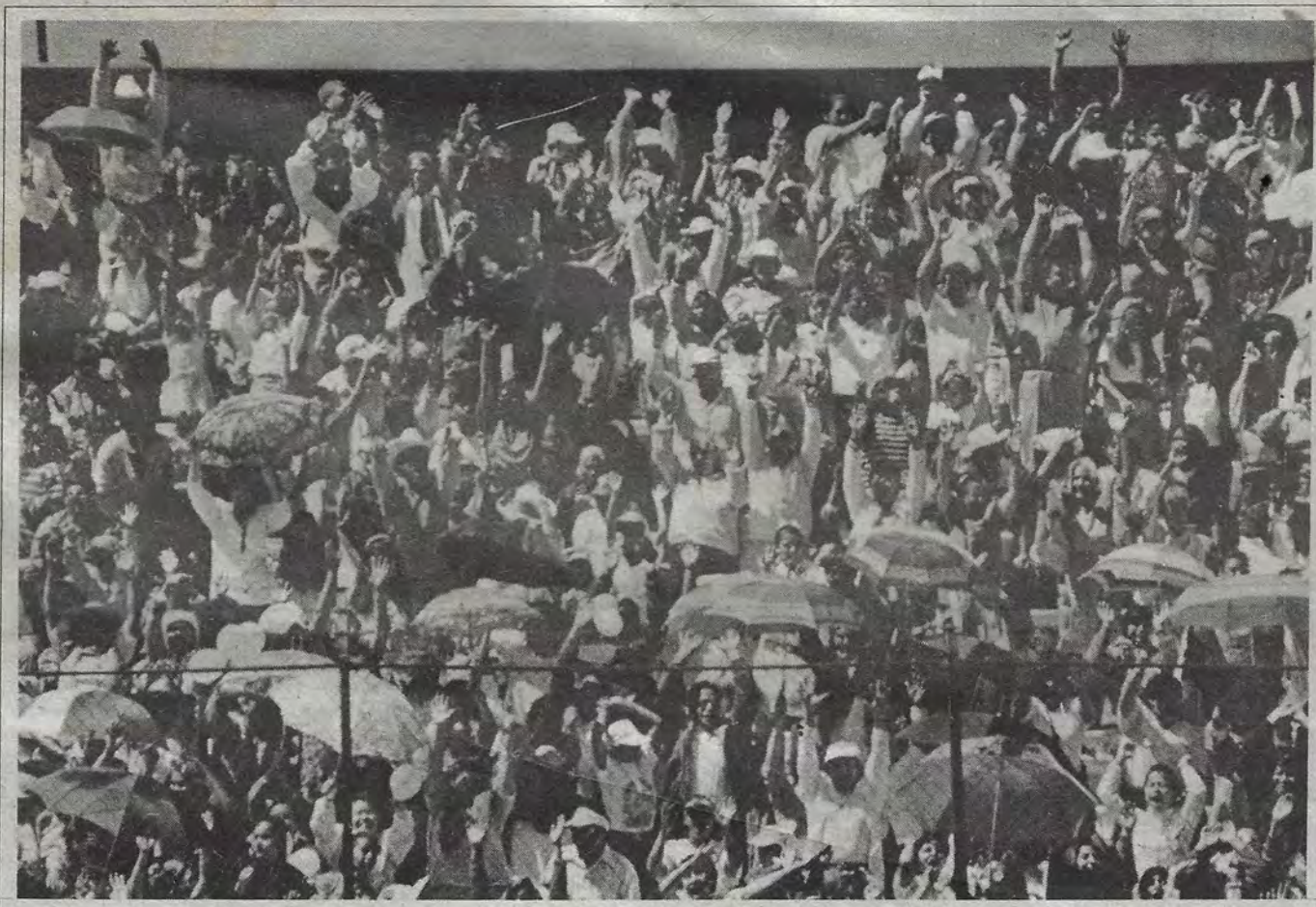
Durante una ola "por la fe" en el Estadio Corregidora.