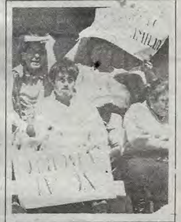
"No al aborto"