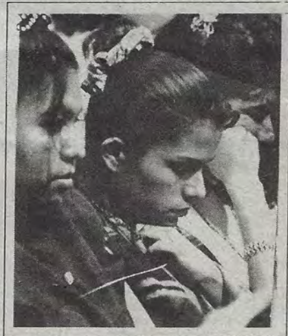
Asistentes al IX Congreso Nacional Anual de la Asociación Mexicana de Estudios Internacionales, que debatió en el Teatro de la República sobre "una nueva idea de la civilización".

Que el Congreso Controle a la CEA, piden Colonos