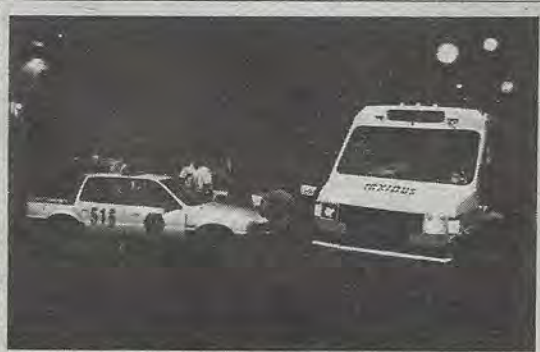
La noche del jueves 19, militantes del PT se movilizan para demandar la liberación de varios compañeros suyos detenidos el martes pasado.

El hombre de blanco representaba al charal, o al hombre proveedor, activo. Y la mujer, la sensualidad, la vida. Juntos, la unión, la sexualidad, el amor, y la reproducción tan deseada. Hasta hoy, cada que recuerdo esta experiencia, pienso en esas personas con admiración y respeto, puesto, que saben: Mantener firmes sus convicciones, a pesar de la influencia nacional y extranjera. Su autenticidad. Su capacidad de agradecimiento.