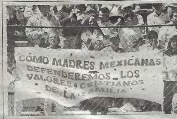
Domingo sin futbol. Domingo de familia.