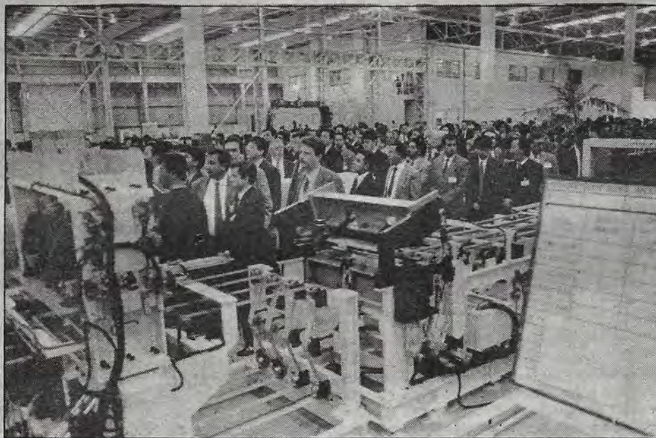
El gobernador Enrique Burgos, el Secretario de Comercio, Herminio Blanco, y ejecutivos industriales durante la ceremonia de apertura.

mano de obra que tenemos en Querétaro, que merece los elogios internacionales de muchos de los empresarios que se han establecido aquí.