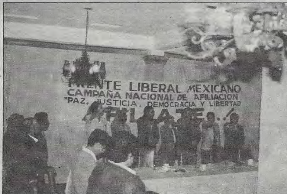
FLM: un nuevo actor irrumpe de cara al 97.