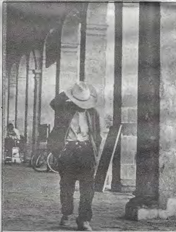
¡Caray!, ¿así empiezan los años?