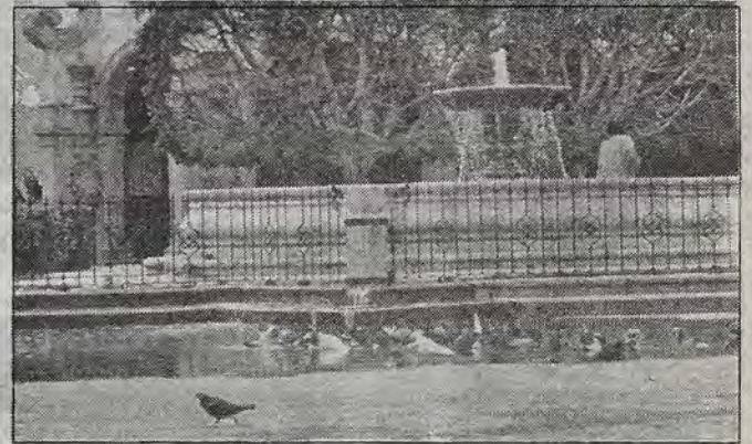
En la Plazuela Mariano de las Casas.