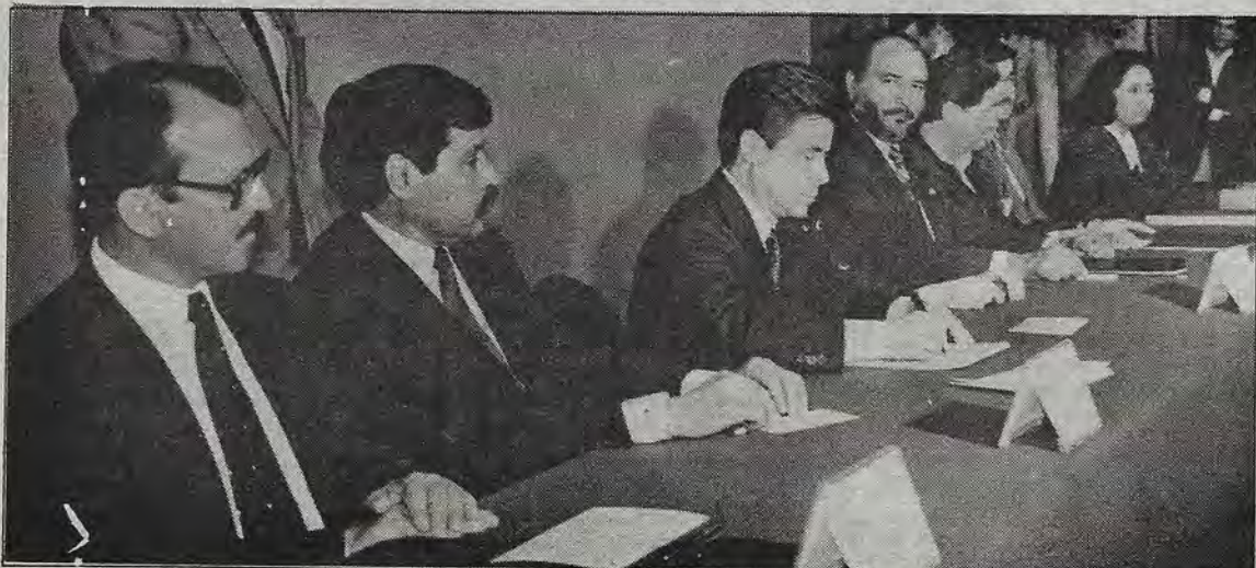
En la instalación de la Comisión para la Reforma Política en el estado de Querétaro.

"Si resultara electo en la presidencia del partido, invitaría a Ernesto Ruffo Appel a formar parte del equipo que lleve al éxito del partido, que asuma las tareas de organización y de atención a funcionarios públicos, área en la cual tiene bastante experiencia". (MGH).