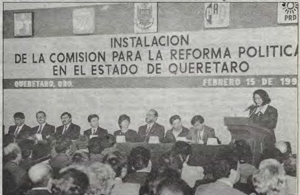
Camino hacia la democracia.

"Asimismo, y al referirse a los problemas que los chontales enfrentan en Tabasco, la perredista calificó al gobierno tabasqueño como autoritario y rechazó las inercias "que se nieguen a los cambios que las nuevas realidades nos exigen".