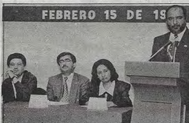
PRI, PT, PRD y PAN en la mesa de la discusión.