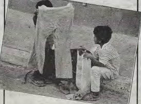
Frente a la carestía, todo lo que caiga es bueno.