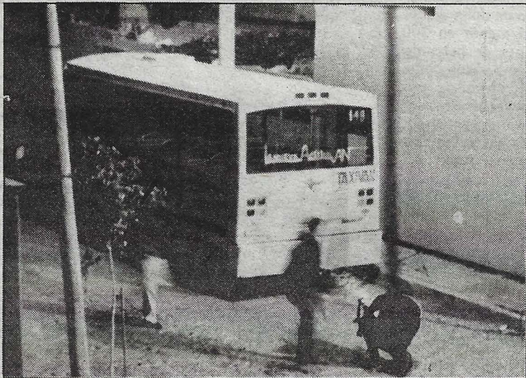
El viernes 16 de febrero, a las 3:40 a.m., varios disparos despertaron a los vecinos de la colonia Constituyentes, elementos de la policía preventiva, que tripulaban las patrullas 204 y 644 informaron que 3 sujetos robaron un autoestéreo de un Taxivan. Lograron atrapar a dos de los tres delincuentes.