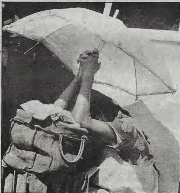
Espectativa en alza de precio de la tortilla.

Desde el punto de vista de las necesidades apremiantes de millones de mexicanos y de mexicanas, de las capas sociales mayoritariamente pobres y extremadamente pobres, se necesita que se sostengan los subsidios a la cadena maíz-harina de maíz-tortilla. Lo que hace falta es transparentar los subsidios para que lleguen a sus destinatarios. La pregunta es: ¿hay voluntad para terminar con la corrupción en la política de subsidios a esta cadena?