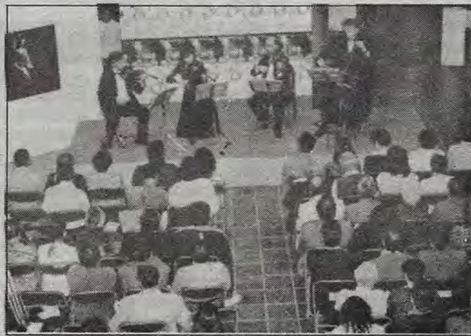
Aspecto general del concierto de cuerdas que con motivo del VIII Aniversario de Radio Querétaro, se llevó a cabo en la Galería Libertad el pasado miércoles 28 de febrero.

que la empresa de autotransportes, "Tres Estrellas de Oro", debe reintegrar en sus trabajos a 300 trabajadores que habían despedido. Y es que en el mundo laboral, en donde muy contenta la CTM festejó sus 60 años de "éxitos", la cosa está también que arde. Basta señalar que pese a todas las barbaridades implementadas en su contra no han podido doblegar ni a los trabajadores de Ruta 100, ni a los sindicatos universitarios. Por otra parte, todos los días se descubren nuevas manifestaciones de corrupción y de