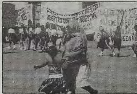
Panorama de mensajes.

"Todo es posible, pero mi punto de vista es que el PRI va a ganar la gubernatura porque se ha demostrado que es el partido que ha trabajado aquí en Querétaro, que ha hecho buena obra de gobierno, muestra de ello es la de Enrique Burgos García, que es una magnífica carta de presentación para los priistas y creo que con una adecuada selección de candidatos el PRI está en condiciones de retener la gubernatura".