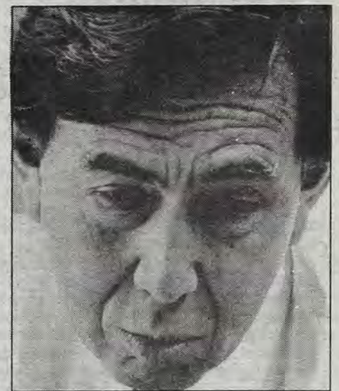
Cárdenas en Querétaro.

Por último, de cara a las próximas elecciones gubernamentales en Querétaro, Cárdenas dijo que espera "que gane la democracia, quien quiera que sea el candidato, que haya un respeto a los votos a la voluntad popular y ojalá los queretanos elijan a alguien que impulse a un verdadero progreso en todos los sentidos".