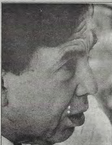
Cuauhtémoc Cárdenas Solórzano: impunidad en Guerrero.

+ El dos veces candidato a la presidencia de la República y ex gobernador de Michoacán dice esperar que la actual situación no lleve al país a la militarización y que las fuerzas armadas se ciñan exclusivamente a la función prevista por la ley + En conversación con este semanario, el dirigente opositor considera que la corrupción es uno de los pilares del poder público + Espera que el país no siga la ruta del fascismo