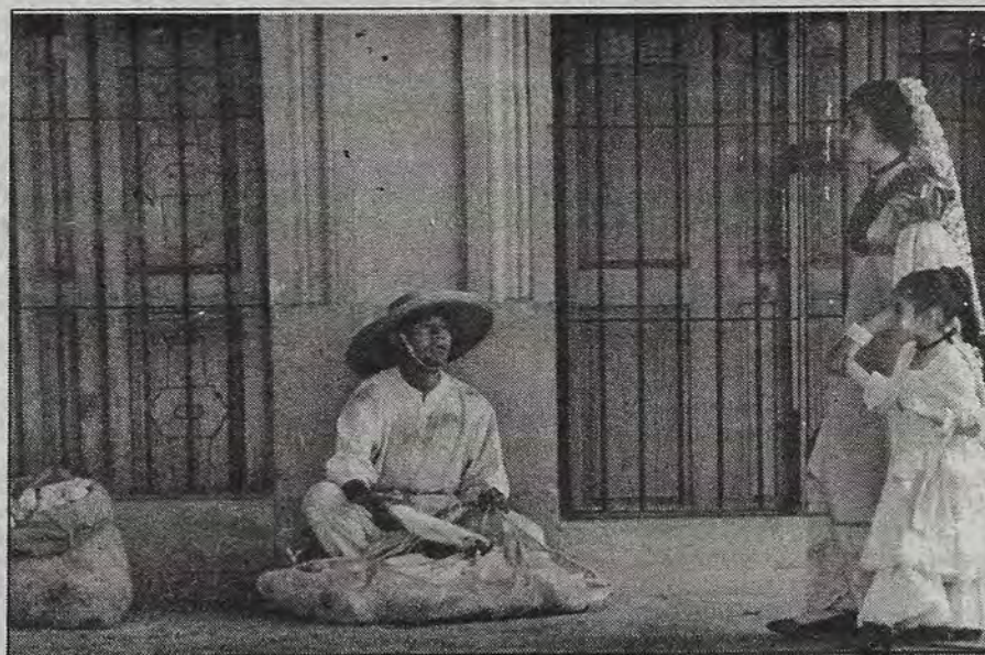
Dos escenas diferentes: plantón de los ñahñus en Plaza de Armas y la filmación de Televisa.