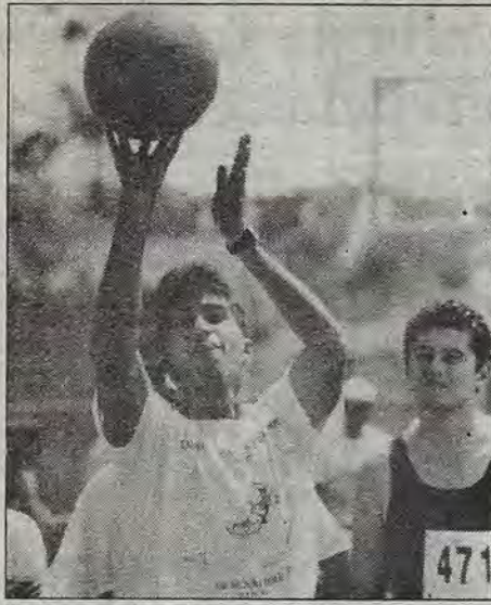
Dignos representantes del Tec.