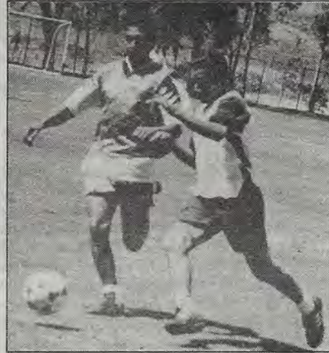
Un juego muy reñido.