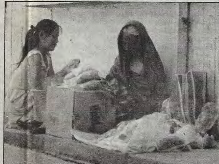
Mujer en dos tiempos.