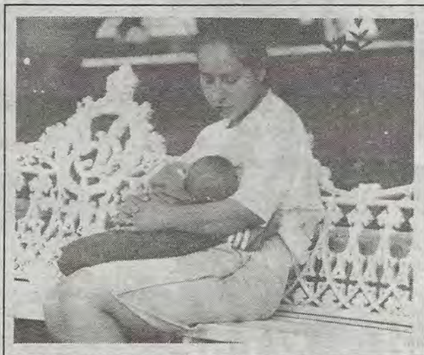
La mitad del cielo. Parte de la exposición fotográfica del Primer Encuentro Estatal de Mujeres.