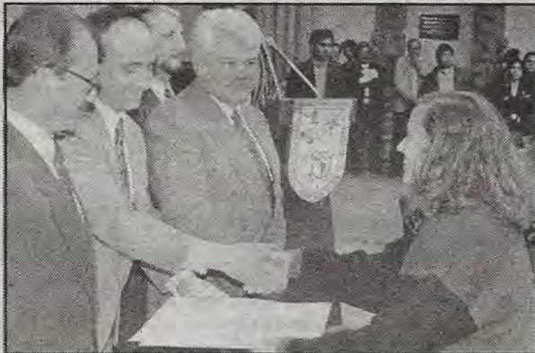
En la entrega de los Premios Alejandrina, el viernes 8 de marzo.

Por su parte, el presidente de la Federación Mexicana de Colegios de Abogados, indicó que esta organización, que integra a 250 Colegios de abogados de la república mexicana, está dispuesta a seguir por la vía del diálogo para encontrar las mejores alternativas a los problemas que a consecuencia de la crisis nacional sufren los deudores con la Banca.