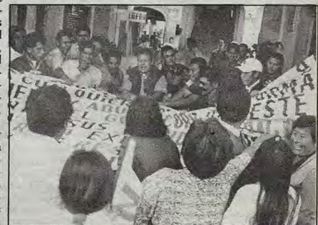
Midiendo fuerzas. Personal del Programa VIVE y manifestantes ante Palacio Municipal.