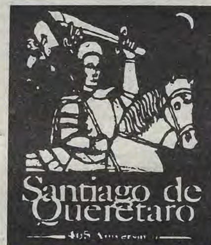
La imagen del Santo Santiago que retoma el Ayuntamiento de Querétaro para promover los 465 años de la fundación de la ciudad.

Frías, que trabajaba iluminado por las luces de un quinqué, establece la transición del análisis histórico del siglo XIX al XX y