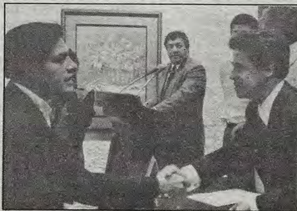
El Gobernador del estado hace entrega de los estímulos a la creación artística 95/96.

El delegado en Querétaro de la Sedesol, mencionó que los 168 maestros beneficiados en este año, están asignados en 13 municipios del estado, y desempeñan sus labores en 76 instituciones públicas y dependencias de los tres niveles de gobierno, entre las que destacan tareas de alfabetización, regularización de alumnos y manualidades.