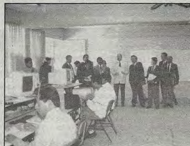
En recorrido por las instalaciones del Conalep San Juan del Río.