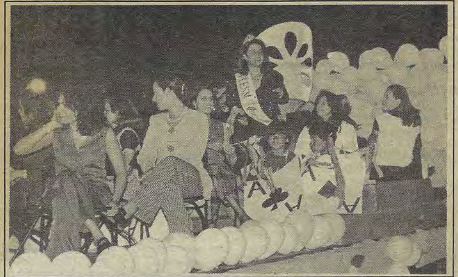
La Reyna del Tec de Monterrey abrió el Desfile Marzo 96. (Foto: Jesús Ontiveros).

El martes de 12 de marzo en el salón del Hotel Mirage se entregó el Premio Federico Mariscal 1995, siendo éste el tercer premio anual de arquitectura que otorga el Colegio de Arquitectos del Estado de Querétaro.