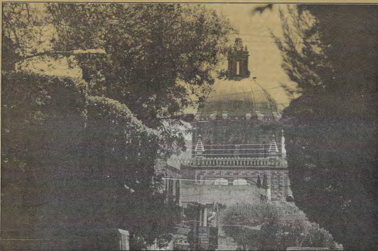
Sobre la calzada Ezequiel Montes, hoy vestida de primavera, se alza solemne uno de los máximos orgullos del barroco queretano.

En adelante, así quedarán diferenciados: el estado, Querétaro de Arteaga; el municipio del centro simplemente Querétaro, y la ciudad, Santiago de Querétaro