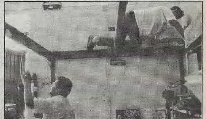
La imprenta Dnamxey, una víctima más de la política emprendida por el Gobierno federal que, vía multas y embargos, está debastando a empresas grandes y pequeñas en todo el país.

Si a pleno luz del día nos mandan golpear, que será de noche, dijeron