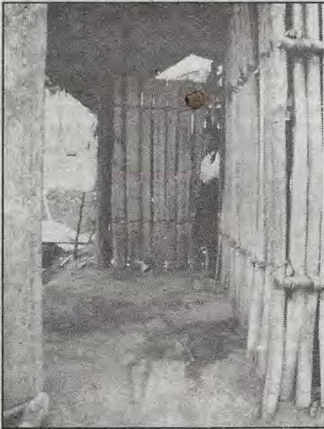
Entre sombras y esperanzas.

dónde podemos pisar y qué podemos hacer. Cero fotos, y por la propia seguridad y de los lugareños, queda estrictamente prohibido entrar a la comunidad o platicar con la gente.