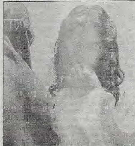
De frente, en Viernes Santo.