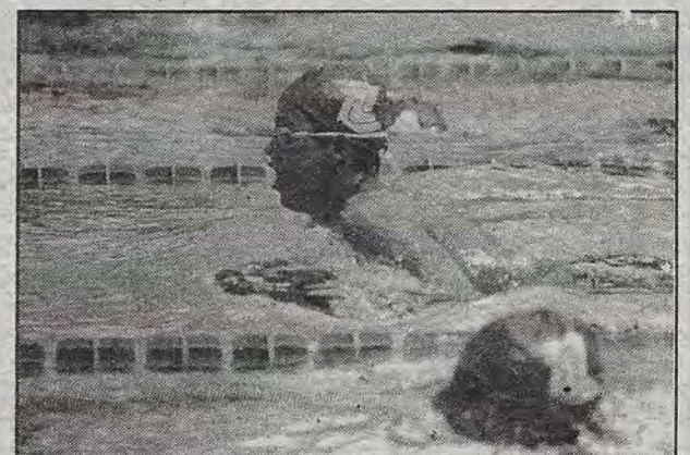
Una refrescada en primavera.

El estallido de la crisis obligó a miles de personas a despojarse del "falso estatus" en que vivían, y tuvieron que entrarle a la resistencia civil + El ex seminarista, catedrático universitario, ex propietario de una tienda de ropa en Moroleón, considera que durante su primer año de vida El Barzón ha contribuido a la transformación cultural de Querétaro + El saldo del primer año: 2 mil 400 apoyos para impedir embargos y remates; 2 mil 500 convenios con 17 cajas populares; 100 negociaciones con arrendadoras y agencias automotrices; 250 convenios con uniones de crédito; 55 convenios con agiotistas; 25 negociaciones con la Secretaría de Hacienda + Además: 10 casas recuperadas, 15 vehículos recuperados y 50 desistimientos de la dictaminación de órdenes de aprehensión