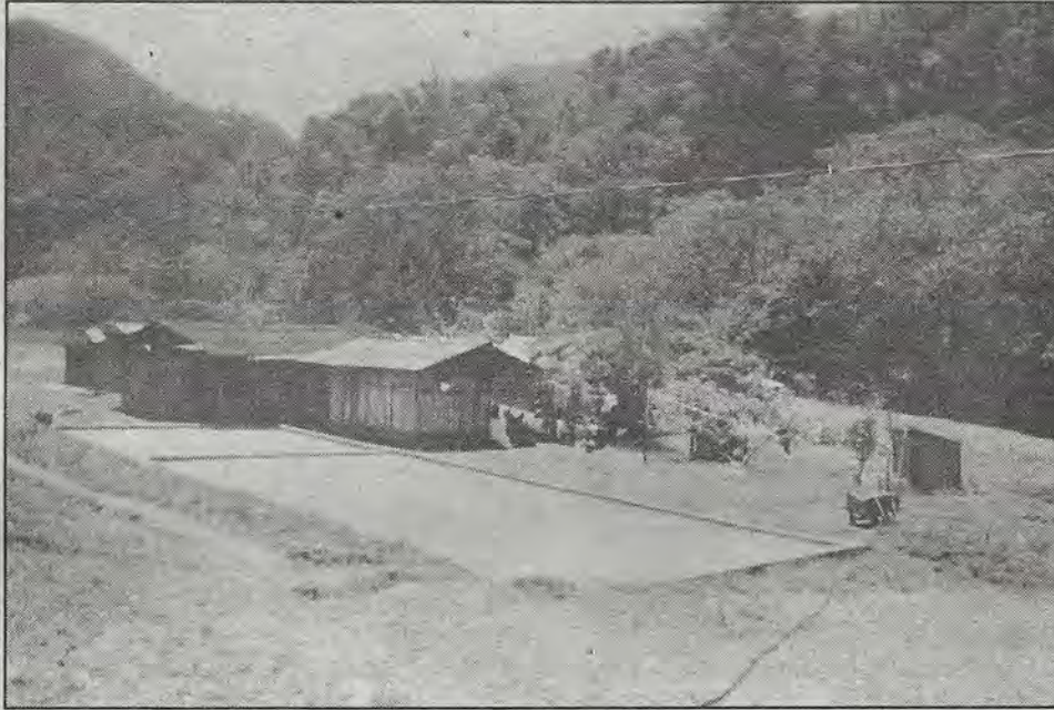
San José del Río, la otra realidad del Encuentro.