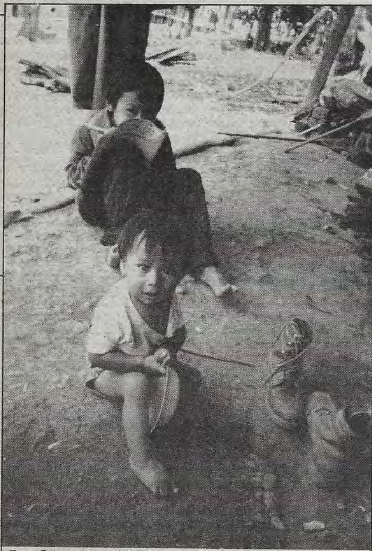
La Otra Realidad