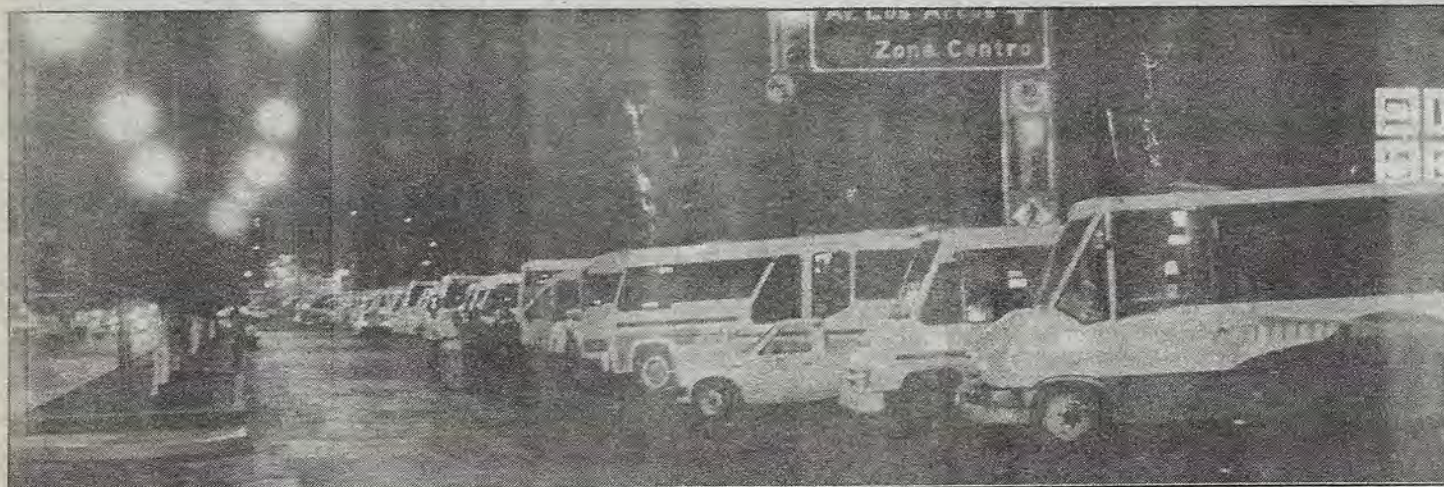
En la Alameda Hidalgo, se congregaron aproximadamente 100 microbuses con sus respectivos choferes y permisionarios como protesta ante los “malos funcionarios”, según sus leyendas escritas en los vehículos y que además señalan que no aceptan la nueva Ruta 103 (con destino a los Socabones), y que fue concedida a los permisionarios de la CTM. Los inconformes no dieron explicación del por qué no aceptan esta nueva ruta.