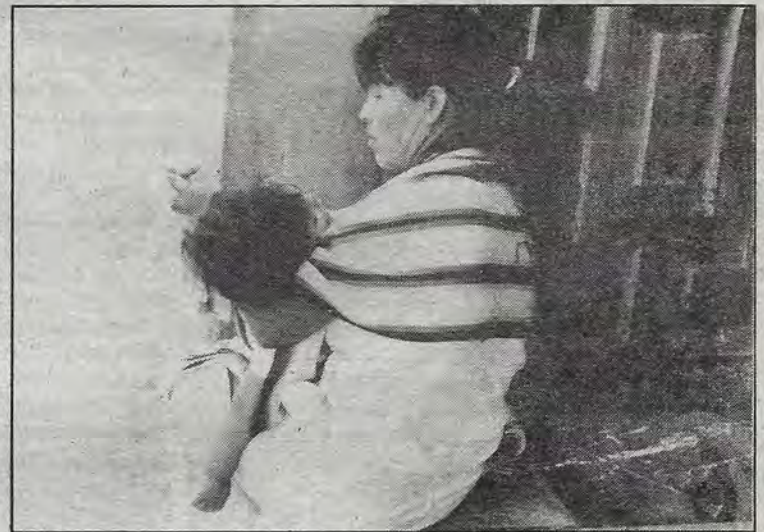
Un descanso en las puertas de la esperanza.

"La zona industrial (donde se encuentra el sistema de