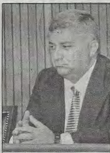
Emilio Chauffet Chemor, Secretario de Gobernación, durante la I Congreso de la Federación Iberoamericana de Defensores del Pueblo, Procuradores, Comisionados y Presidentes de Comisiones Públicas de Derechos Humanos.

"Se advierte un panorama no muy alentador"