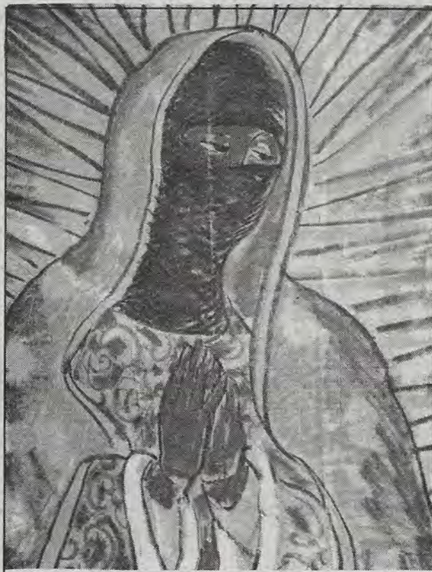
¿Quién se esconderá detrás del pasamontañas? ¡A saber...!

una comunidad como La Realidad —cuartel general de una comandancia guerrillera—, que bajara una veintena de soldados de los camiones, no empuñando las armas ni matando a destajo, sino con las manos llenas de bolsas de dulces "para repartir a los niños". Tampoco habían visto niños de una comunidad rural rechazando los dulces, ni a los soldados aventándolos por el suelo, despechados, y tampoco, que siguieran después su camino tan campantes, sin ejercer más prácticas de prepotencia que las de un machito de película, ni acciones violentas contra los presuntos guerrilleros. Con sus experiencias anteriores en la cabeza, preguntaban una y otra vez: ¿Por qué no los aniquilan, hecho que podrían hacer desde el aire en quince minutos? ¿Por qué reparten dulces, ridículos dulces...? ¿Qué ejército, qué guerrilla, qué país, qué Realidad tan surrealista es ésta...?