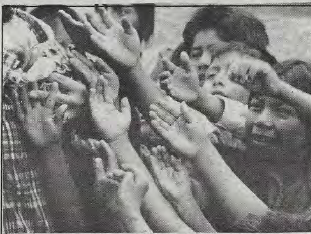
De los cuates sí aceptan globos los niños.

Por lo pronto, Semilla del Sur y Médicos Alemanes para el Tercer Mundo esperamos que los ejércitos no confundán —como es su costumbre novelesca— la construcción de la Casa de Salud con la de un imaginario "Cuartel Militar" para, en operativo quijotesco de "alerta roja", invadir y destruir la supuesta "artillería enemiga".