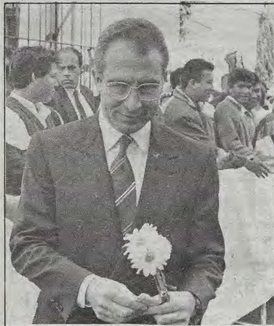
Por los derechos humanos...