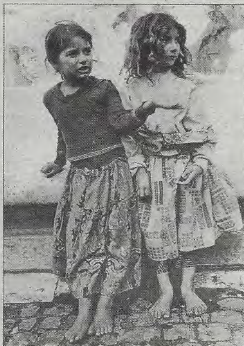
La obra de quince fotógrafos seleccionados por el Sistema Nacional de Creadores se expone en el Museo de Arte de Querétaro. Esta presentación forma parte del convenio de Intercambio Cultural Centro-Occidente, impulsado por el gobierno del estado y el Consejo Nacional para la Cultura y las Artes.

Hay fotos de Manuel Alvarez Bravo, Daisy Ascher, Rogelio Cuéllar, Pablo Ortiz Monasterio y Paulina Lavista, autora de esta gráfica.