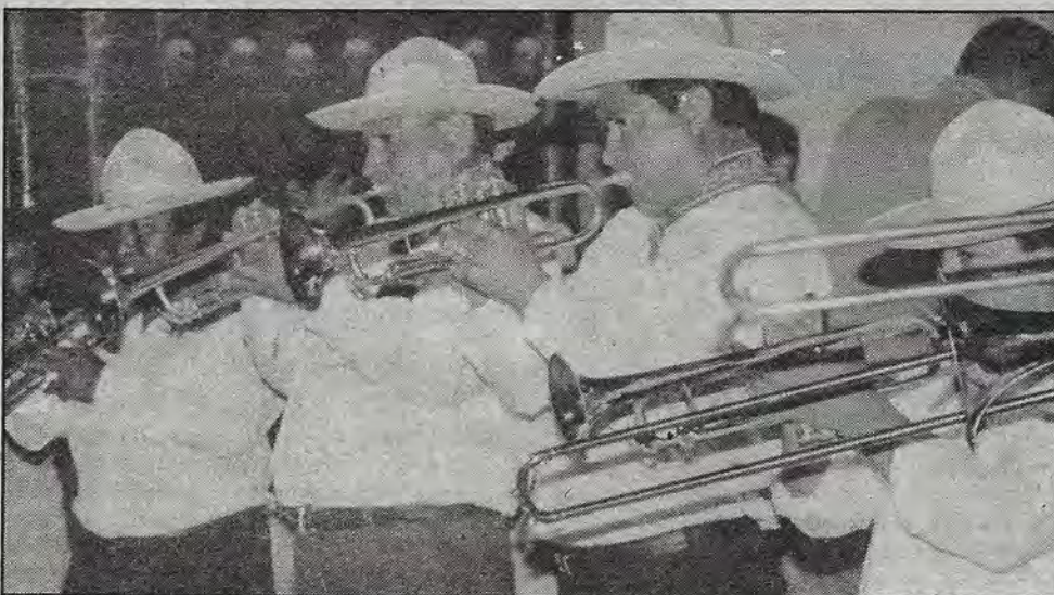
Músicos. (Foto de Jesús Ontiveros).