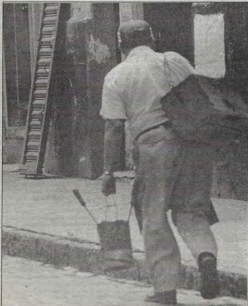
Hacia la marcha por el trabajo diario..

La denuncia contra el ISSSTE irá a la CEDH, dice su esposo