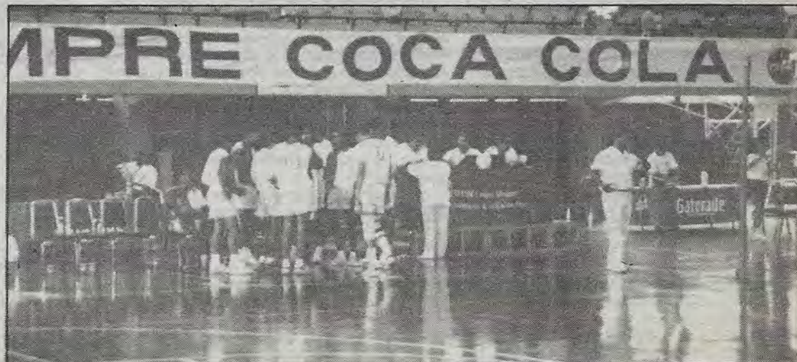
Esperando el silbatazo para iniciar el juego.

El 3, 4 y 5 de mayo se va a llevar a cabo el Intercampus en Instituto Tecnológico de Estudios Superiores de Monterrey, Campus Querétaro. Participarán 1100 deportistas provenientes de 13 Campus del Sistema Tecnológico de Monterrey, entre ellos León, San Luis Potosí, Toluca, Hidalgo, Irapuato, Cd. de México, Veracruz, Morelos, Garza Sada, Zacatecas, Saltillo y Guadalajara. Se organizarán partidos y competencias de basquetbol, futbol soccer, tenis, natación, Tae kwon do, voleibol y futbol femenil.