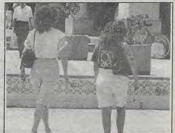
En primavera, pasos firmes por la ciudad.