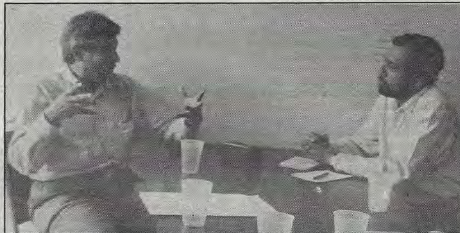
En la redacción de El Nuevo Amanecer.

Por Efraín Mendoza y Víctor López Jaramillo