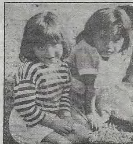
Con una mirada llena de esperanza.

El Barzón: a un año del despertar de la sociedad civil queretana