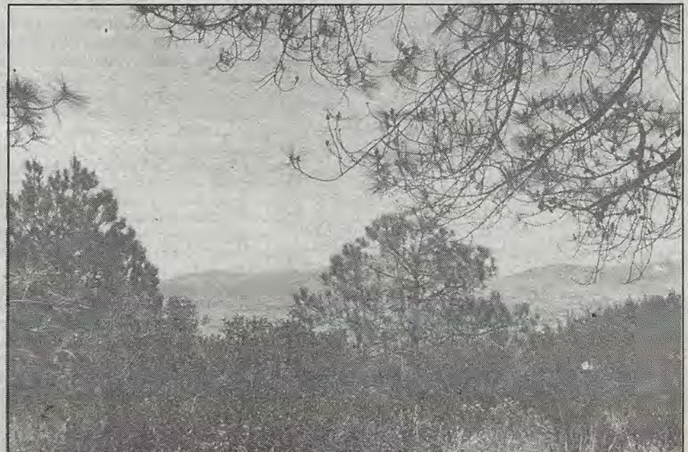
Paisaje queretano.

Penalistas, criminólogos y hasta abogados del PRI han levantado sus voces de repulsa a estos engendros de Dracón o Torquemada con orejas electrónicas estilo CIA. Esperamos que las fracciones más sanas del Legislativo sean capaces de modificar y aun eliminar las peores partes de estos proyectos.