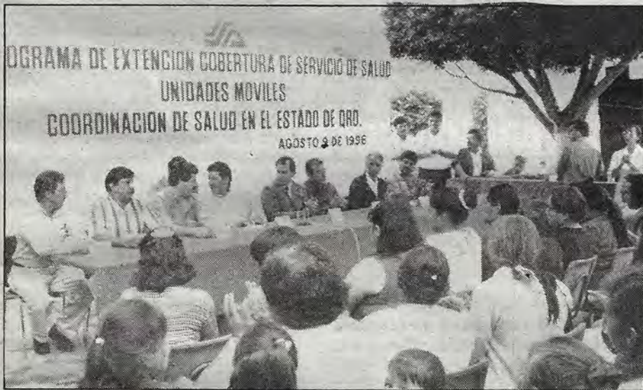
Durante la firma del convenio con los municipios.

municipios. Luego de visitar los municipios mencionados, Rojas Zetina aprovechó su estancia en San Juan del Río para inaugurar nuevas casas de salud en las comunidades de Palmillas y El Rodeo, donde entregó una dotación de mayor medicina y material de curación para otras unidades como las de El Rosario y el Sauz, esta perteneciente al municipio de Tequisquiapan.