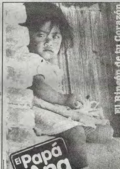
El Rincón de tu Corazón

En nuestras culturas no ha faltado la visión determinista y esencialista en torno a las mujeres: su mundo está ya dado desde antes de que nazcan y su papel será ser reproductora, tanto en lo biológico como en lo relativo a situaciones culturales.