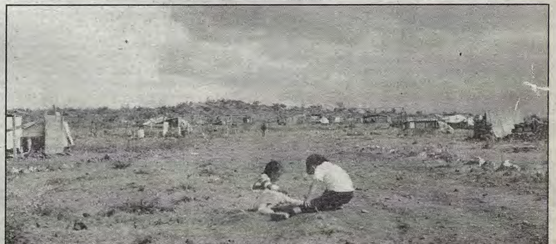
El primer asentamiento proclamado zapatista.