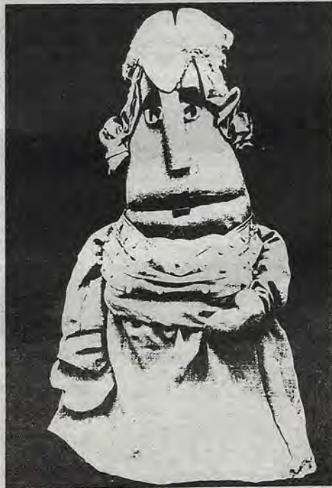
Muñeco de La rana sabia , Quito, Ecuador.

Han dictado talleres y formado grupos de títeres realizando videos culturales para Unicef y diversos organismos de cultura de su país y de Italia.