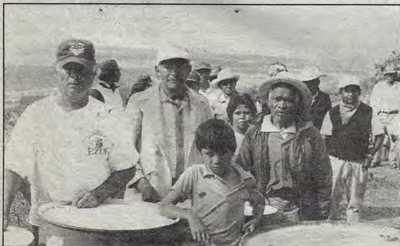
Al fondo, La Cañada.