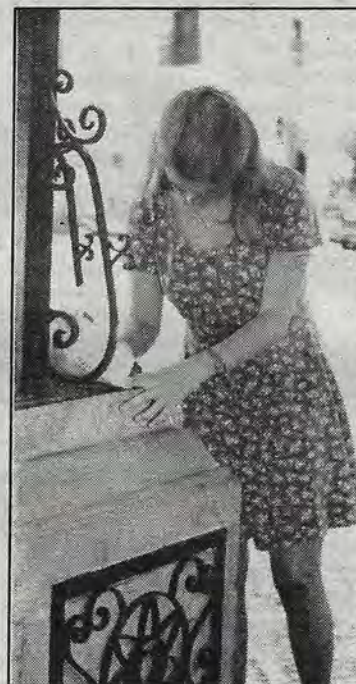
Durante la jornada de condena a la política económica.

"Si, este es", dijo entonces presidente del PRI