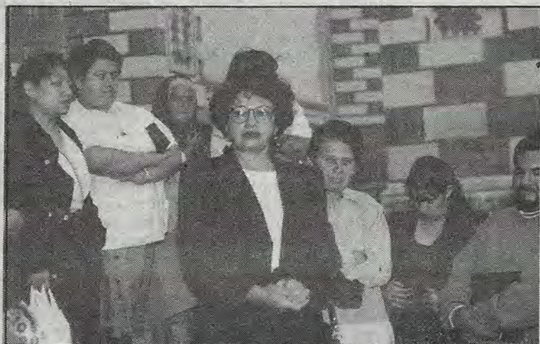
Laicos movilizados.

salesianos entreguen formalmente el templo de Santa Rosa de Viterbo al clero diocesano, varios vecinos católicos del barrio de Santa Rosa, advierten: