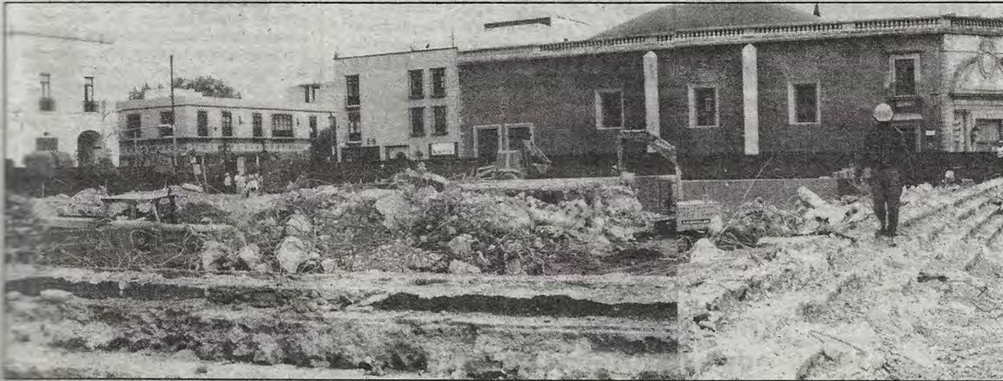
Las excavaciones en la Plaza de la Constitución. En esta plaza que se popularizó como "la plaza de la prostitución" y donde hace décadas existió el Mercado Escobedo, se construye un estacionamiento de tres niveles.