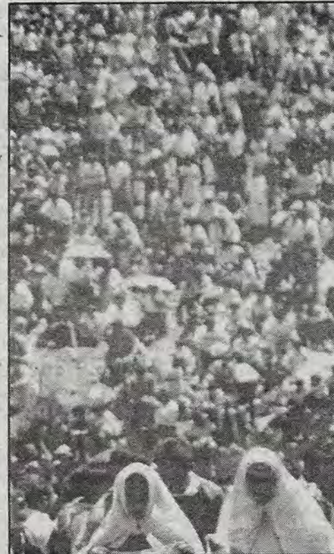
El grave problema de los tumultos.

"Yo me pregunto ¿qué hacen las autoridades para que esta persona siga jugando con ellas, sigue y sigue haciendo bailes, como si nada hubiera pasado. Yo ya no lo digo por mi hermana, porque ya nada se puede hacer por ella, yo lo siento por toda la gente que va a esos bailes sin seguridad".