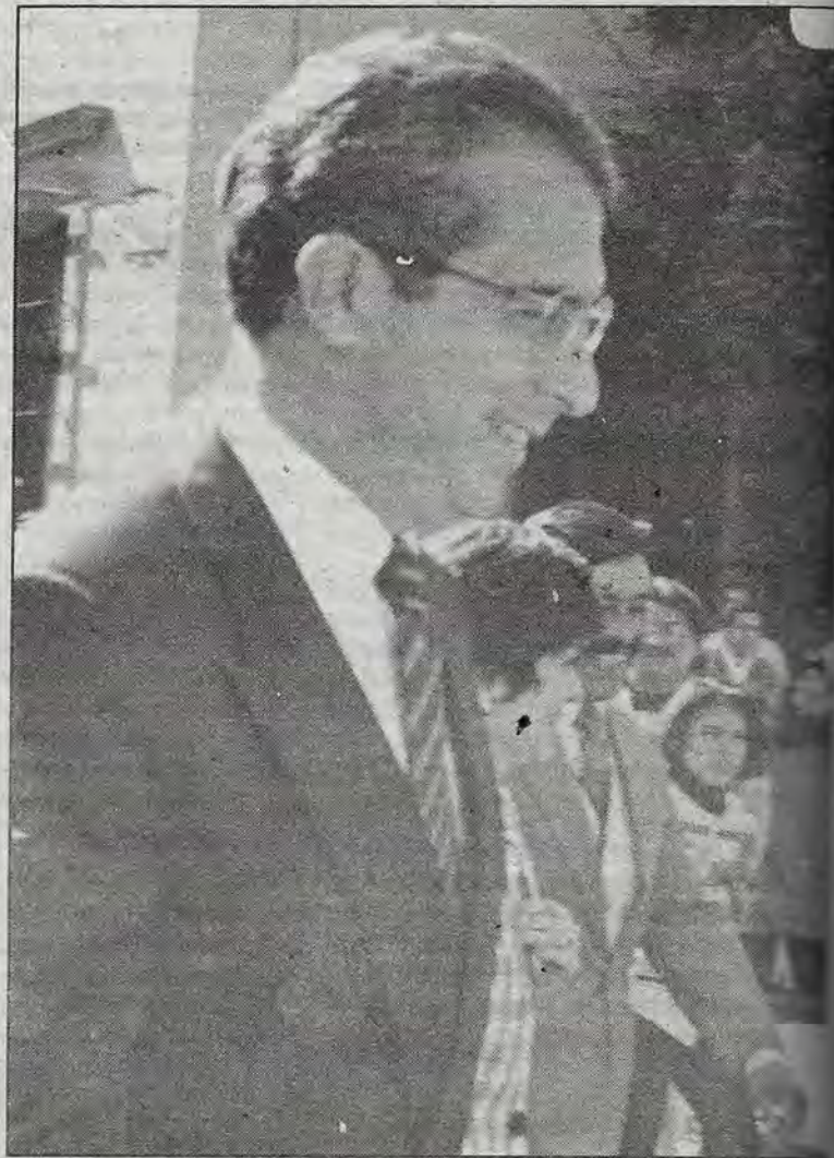
Una "obra magnífica".