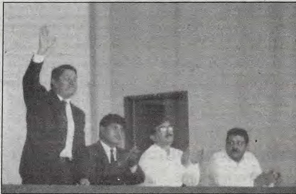
De pie, el aspirante petista.

El PT lo que busca “es gobernar” y está “trabajando para ser la primera fuerza política del país. En Querétaro hemos iniciado ya nuestra campaña precisamente buscando ser el número uno. Nadie entra a una contienda para perder; por eso nuestro lema es: unidad nacional, todo el poder al pueblo. Y tenemos poder para vencer. Creemos que donde hay ganas hay poder, nosotros tenemos todo nuestro empeño y nos estamos preparando con toda una infraestructura para la campaña, y vamos con todo y por todo, desde la gubernatura hasta las presidencias municipales, por las diputaciones federales y senadurías. Nuestro afán es ir por todo, no