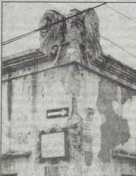
El remate de esta derruida vivienda podría venirse abajo.