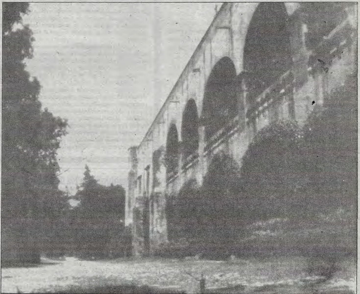
La ex hacienda de Chichimequillas.