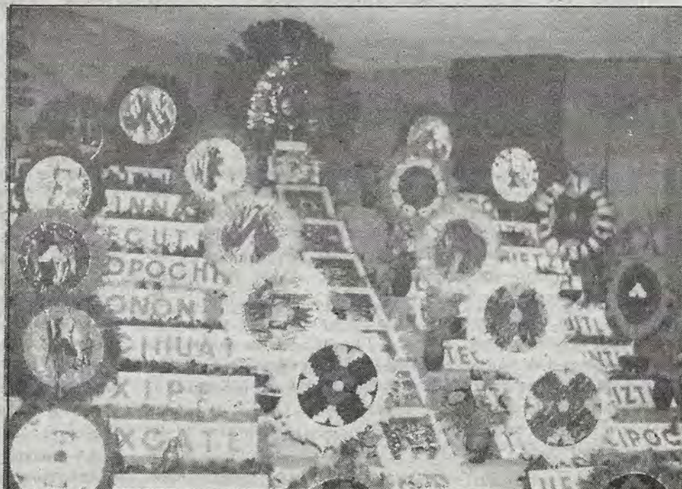
Ofrenda de muertos en el IMSS..

En este sentido, el compilador enumera algunas razones que los científicos disidentes tienen para sostener que el VIH no produce Sida. Como por ejemplo el hecho de que: "El VIH es eficazmente anulado por los anticuerpos, que el VIH es escaso en portadores asintomáticos y en pacientes con Sida, que hasta 1992 había 4,621 casos de Sida sin VIH, así que no hay nada común entre las 25 o 30 enfermedades que componen el Síndrome del Sida; ni los síntomas, ni el tratamiento eficaz de esas enfermedades varían por la presencia o ausencia del VIH; que sólo el 50 por ciento del Sida en USA tiene pruebas de presencia de VIH, que el VIH es abundante en África y que produce poco Sida y que es escaso en USA y produce mucho Sida, que el VIH es un virus viejo según ley de Far, y sin embargo produjo una nueva epidemia; que el VIH de supuesta transmisión sexual no ha producido epidemia heterosexual de Sida y está prácticamente ausente de la población sexualmente más activa: los adolescentes; y que el VIH y Sida son escasos en occidente al interior de grupos que practican prostitución sin consumo de drogas".