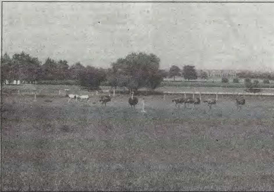
Avestruces y ponies en la Araceli. Abajo, niños de La Piedad, curiosoando.

Por Agustín Escobar Ledesma (Colectivo Mitote)