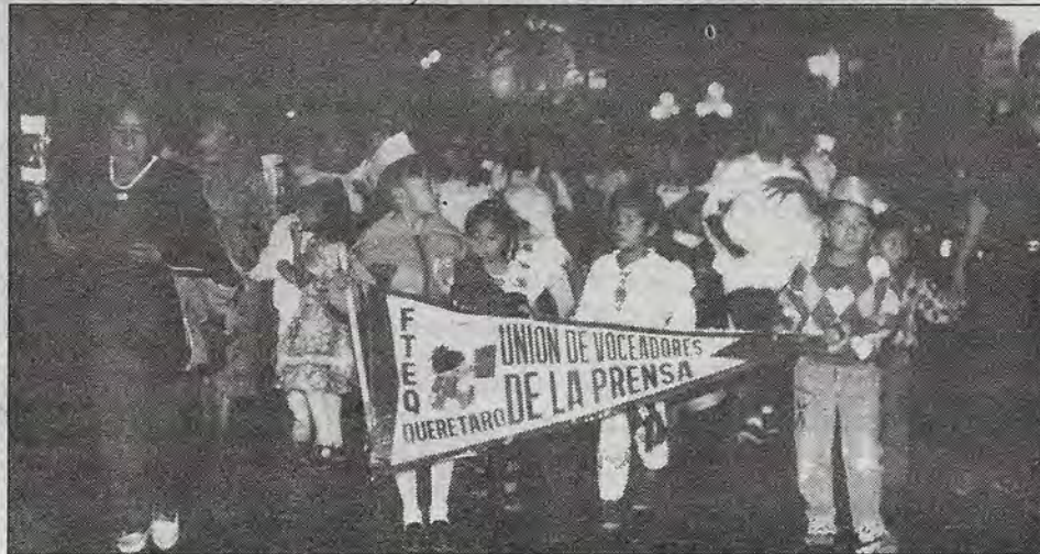
El jueves 3 la Unión de Voceadores de la Prensa realizó su peregrinación número 25 al Santuario de Nuestra Señora de Guadalupe (templo de La Congregación). Partió del tanque de Zaragoza y recorrió las principales calles del centro de la ciudad. Acompañados de sus familiares, los voceadores oraron y entonaron cantos guadalupanos durante el recorrido.