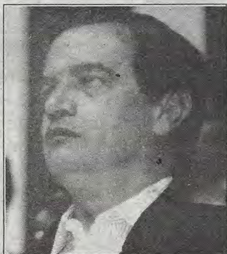
FOA: el elegido