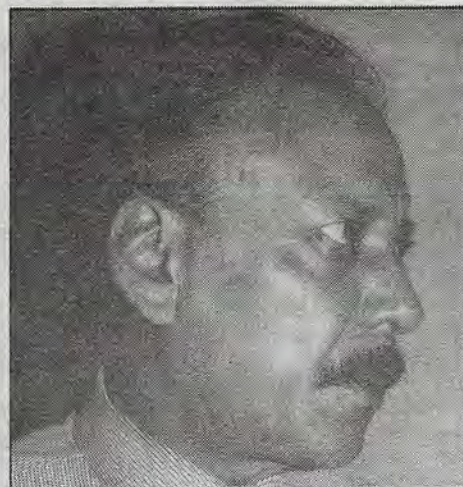
Durante la conversación en la redacción de El Nuevo Amanecer .

Estando así las cosas el éxito tripartidista va a ser coyuntural y debe surgir como una nueva propuesta creciente la socialcristiana, que representa el Demócrata Mexicano y que no se identifica con el capitalismo. El socialcristianismo se puede ubicar en todo el país y en todo el mundo, y por esta racionalidad el socialcristianismo lo pueden hacer suyo los creyentes igual que los no creyentes. Otra