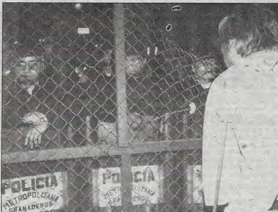
Más violaciones documentadas que en ninguna otra época.