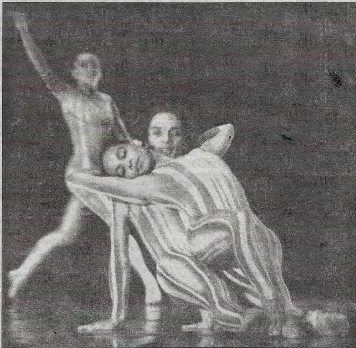
Homenaje a Cervantes, de Guillermina Bravo, directora y fundadora del Ballet Nacional de México, fue la coreografía que cursó el programa de la Temporada de Otoño de esta compañía en el Auditorio Josefa Ortiz de Domínguez.

El PRI ha gobernado mal y el PAN ha sido colonizado por el fundamentalismo de la extrema derecha, afirma el escritor que conmocionó a la sociedad queretana en los 60s y que hoy representa a México en Puerto Rico