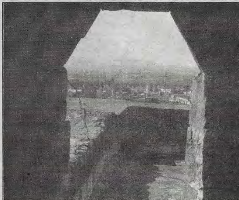
La ciudad desde la terraza del templo de San Agustín.

La mañana de este lunes 17 de diciembre la presidencia de la Legislatura del Estado tomó la protesta a los 14 integrantes del Consejo General del Instituto Electoral de Querétaro, órgano que bajo el nuevo marco legal dirigirá, con autonomía, los procesos electorales.