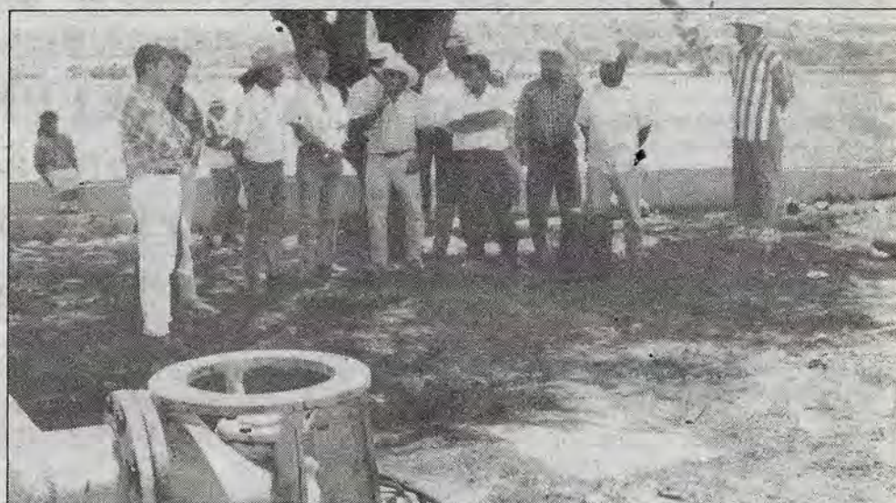
Mejorar la infraestructura urbana.

En este evento realizado en el Salón Acueducto II del Hotel Holida Inn, y en el que se hizo público el reconocimiento a la labor que los trabajadores de la salud desempeñan en beneficio de los queretanos, el funcionario —que sustituyó a Víctor Arturo Rojas Zetina— les invitó para que sigan trabajando "con empeño y delicadeza sobre todo en estos tiempos donde se requiere mayor esfuerzo para mejorar el nivel de vida de los queretanos".