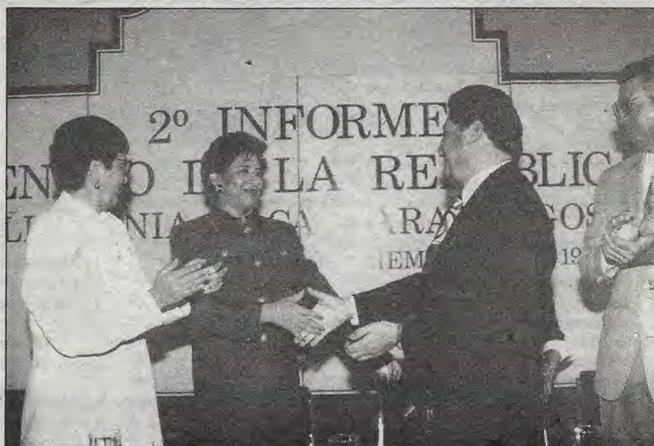
Alcántara Magos: mesura.

Por último, la legisladora queretana indicó que en este último año dispuso la ejecución de mil 58 acciones diversas en materia de asignación de becas, empleos, capacitación, vivienda, salud, asesoría legal, asistencia social y apoyo de materiales.