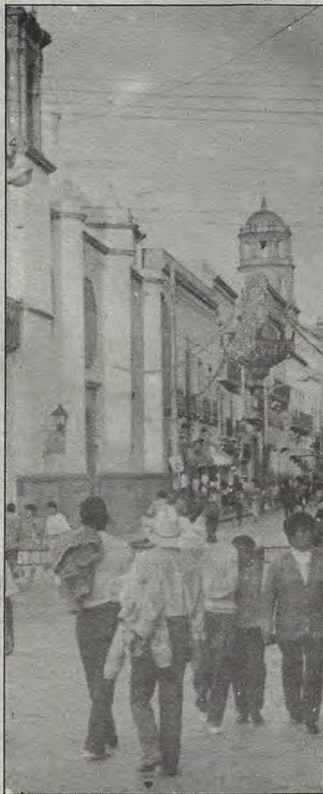
Querétaro seguirá creciendo.