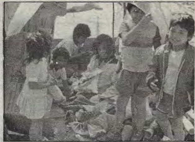
En una de las chozas.