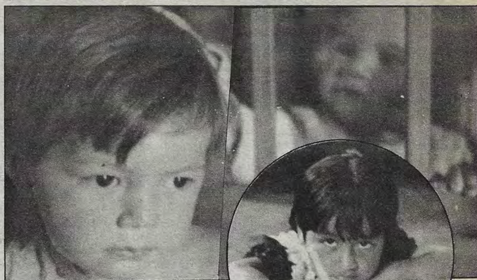
Ubirajara, Mariceu e Iracema

Y dijo el niño: ya sabes, no hay que destruirlos porque a los reyes le costaron mucho dinero. Y le platicó la historia que fue con ellos y recorrió todo el mundo y que le dejaron una nota y le dijo: oyes, tú puedes hacer conmigo obras, y dijo el otro niño: sí, me encantaría.