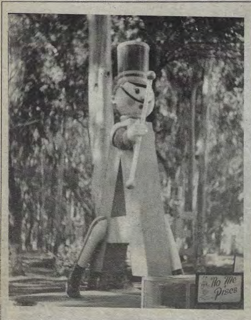
Ahi viene la A... Aaaaa.