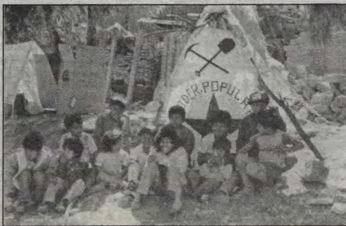
Reportaje de Efraín Mendoza, página 5.

+ Obligadas por la apremiante necesidad de vivienda, entre la noche de fin de año y el año nuevo, 16 humildes familias se instalaron en una propiedad ociosa ubicada sobre la Av. 5 de febrero + Al parecer el terreno pertenece a Luis Cobo Frade + "¿Un desalojo?... ¡No nos puede ir más mal de lo que ya nos ha ido!", responden los "paracaidistas" + Pertenecen a la Unión de Colonias Populares + Piden que Comevi les dote de vivienda