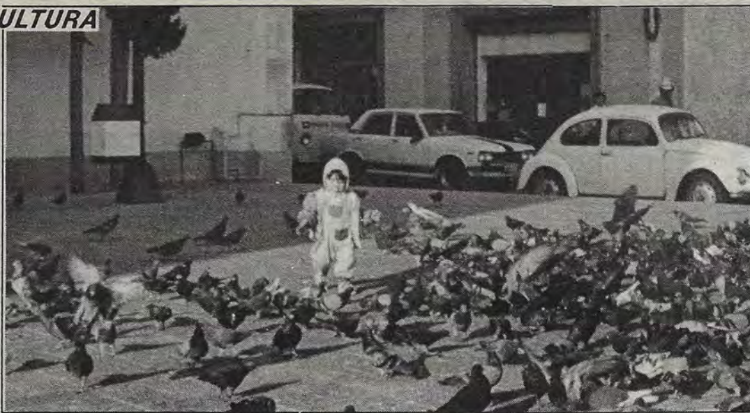
Armonía con la vida. (Foto de Israel Ontiveros).

Por otra parte, el Instituto, dependiente de la Secretaría de Cultura y Bienestar Social, informó que se pospuso para el mes de marzo el inicio de los trabajos en el Centro de Alto Rendimiento Deportivo, mismo que se instalará en la Unidad Deportiva y Ecológica, ubicada al norte de la ciudad.