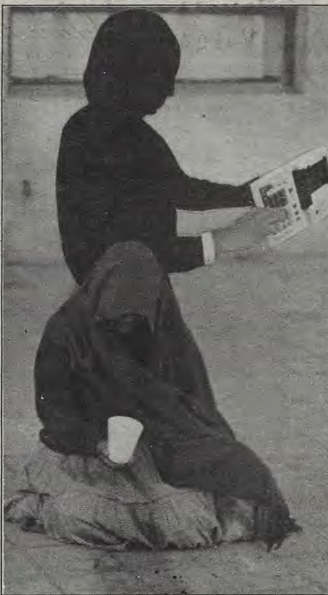
¿Miscelánea fiscal?... ¡Aguas!

Espero que ahora LOS REYES MAGOS traigan consigo la paz a esta tierra.