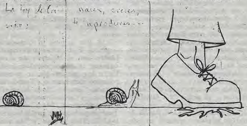
© Sacarrones Ilustrados, presentó: El caracol encuentra a Eliseo. o, El desencuentro

Respuestas: 1-a; 2-c; 3-c; 4-a; 5-b; 6-b y 7-c.