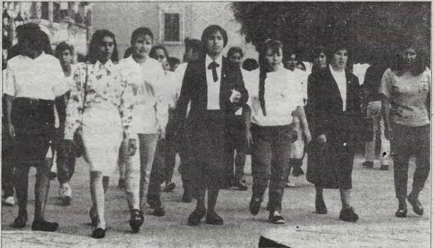
Durante la Semana Santa unos corren para la playa, otros aprovechan para conocer la ciudad barroca, y otros se recluyen en los montes o los monasterios para pensar que será de sus vidas.