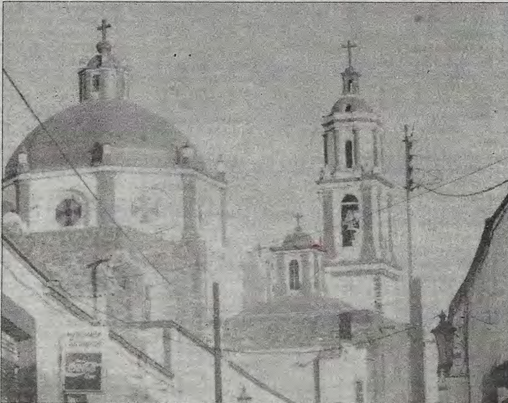
Campanarios en una tarde mostaza.

en el partido y el otro dentro del aparato del gobierno o sistema, mucho cuidado"... Qué mala onda, lo hecho está consumado. ¿O habrá otro cambio de última hora? ¿Cuál va a ser el resultado de este grave proceder en la dirección estatal?... y pensar que el SOL AZTECA es el futuro de México, políticamente hablando. ¡Si somos el futuro en la vida política de esta gran nación!... ¡Que irónico!