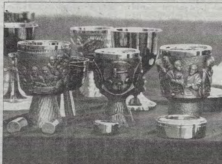
Entre el culto y la grilla: la Semana Santa de 1997, marcada por la ebullición política.