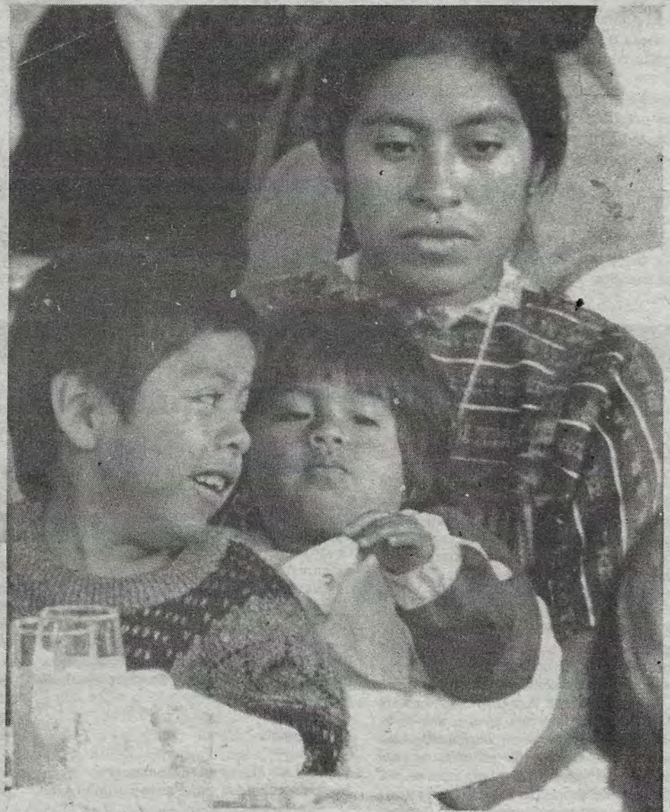
...de la familia.

Fue reabierto la Agencia Especializada en Delitos Sexuales y del Orden Familiar