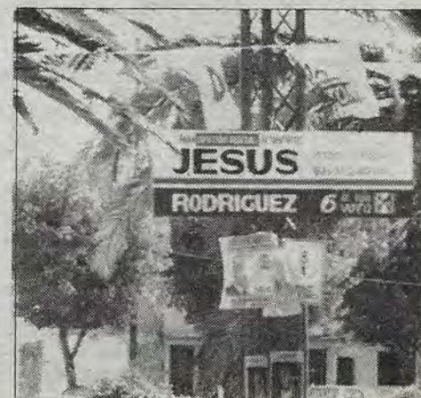
A comenzar de nuevo

futuro del PRI, si éste sigue en manos de los tecnócratas —declara—, y más específicamente de personas como el ex Secretario de Gobernación y ahora senador Esteban Moctezuma, tenderá a dividirse y a desaparecer.