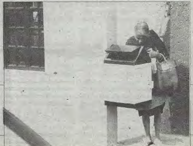
Hay familias que para comer... sudan.

—Querétaro, uno de los priismos mas "fieles y tradicionales". Un PRD local que durante cinco años sirve para maldita la cosa (que me perdonen mis cuates "amarillos", los hechos son contundentes). Una crisis económica y un liberalismo que reducen dramáticamente populismos y paternalismos que mantenían la sumisión. Un verdadero bisoño en la liza política que, sin estentórea verborrea, sin flamígera oratoria, se desplaza hablando de tú a tú con todos. Nacho Loyola se beneficia de su sencillez y de su creencia a un estado (Guanajuato) donde hoy existe mejoría (no digamos más). Un movimiento magisterial enorme, desbordante, que a pocas semanas del sufragio politizó como nunca antes a un estado donde el militante había sido siempre "rara avis". Un gobierno que contestó a la salinista "ni los veo ni los oigo". Barzonistas y otros deudores que pusieron esperanza en el PAN. Seguiremos reflexionando.