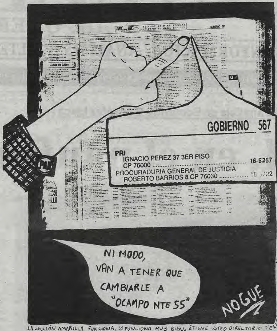
LA SECCIÓN AMARILLA FUNCIONA, Y FUNCIONA MUY BIEN. ¿TIENE USTED DIRECTORIO TELEFONICO DE 1997? ¿PUES CONSULTELO! (PAG 567)