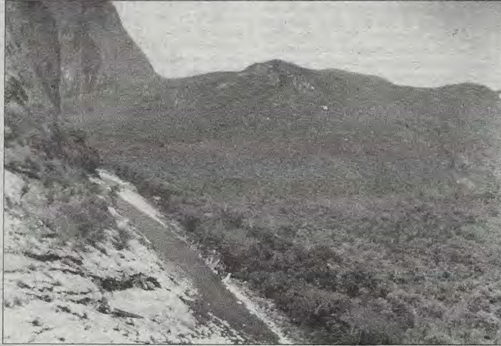
Una región de oportunidades