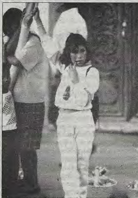
Agarradas de un árbol