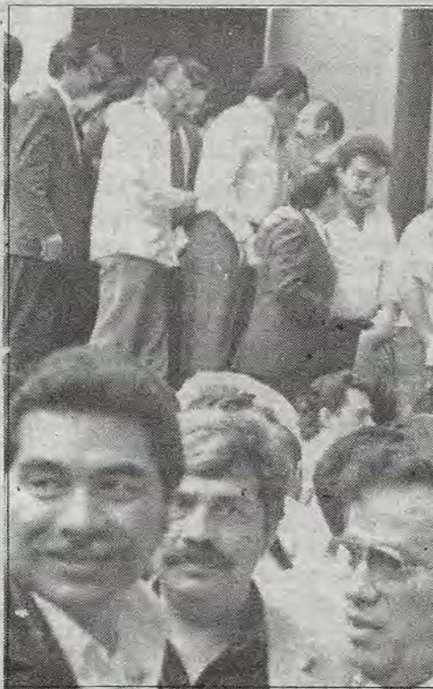
Eran otros tiempos