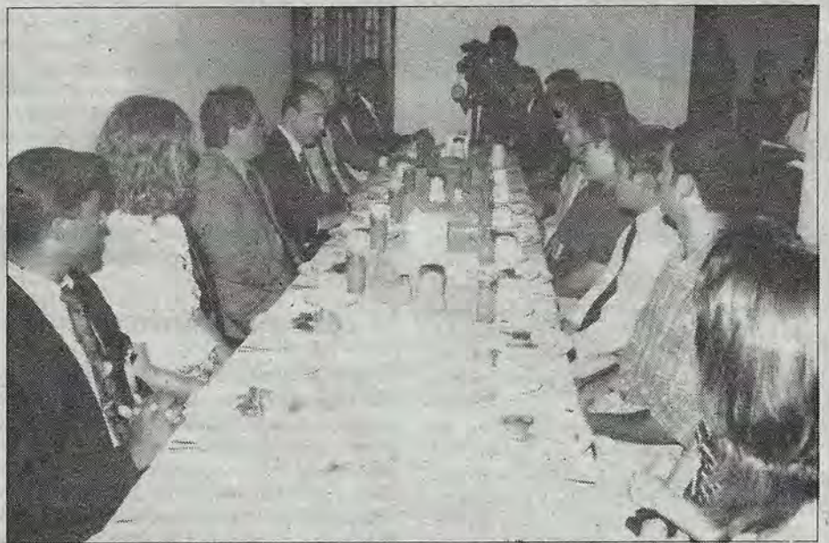
Estrechar relaciones con otras instituciones educativas.