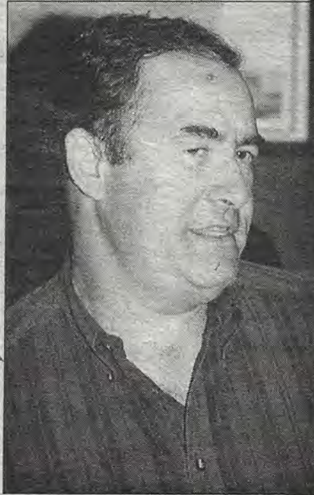
Durante la entrevista

—Se tendrá que hacer dos o tres auditorías por año. La primera se realizará en noviembre o diciembre. Primero tenemos que tomar posesión de la administración. A más tardar