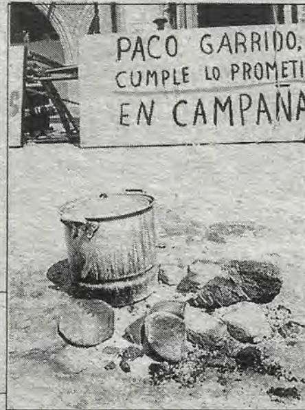
En Satélite.