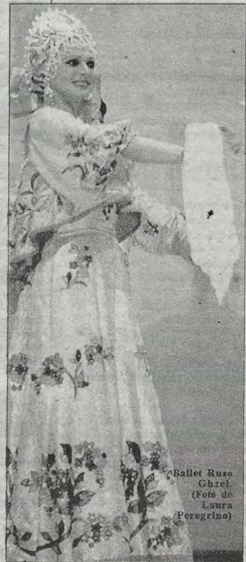
Ballet Ruso Ghzel.