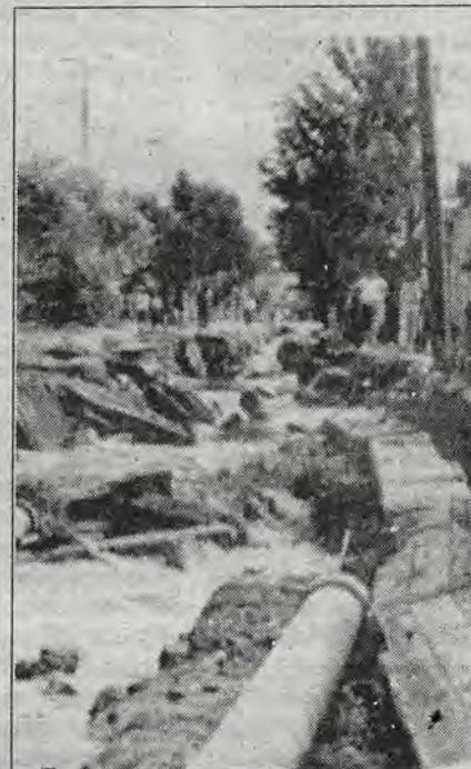
La colonia Lomas de Querétaro.

Al mediodía del sábado algunas calles de Lomas de Querétaro eran todavía auténticos ríos. El pavimento quedó destruido, la corriente arrastró vehículos por varios metros y amanecieron chocados. Las coladeras, empedrado de la calle, parecían fuentes