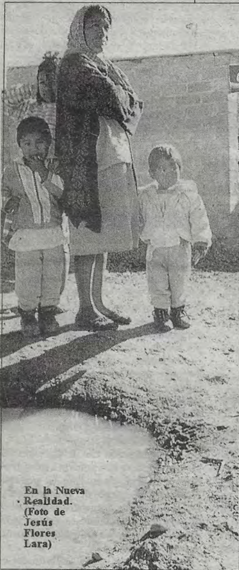
En la Nueva Realidad.

Se mueren sólo los que nacen muy chiquitos o los compañeros flacos