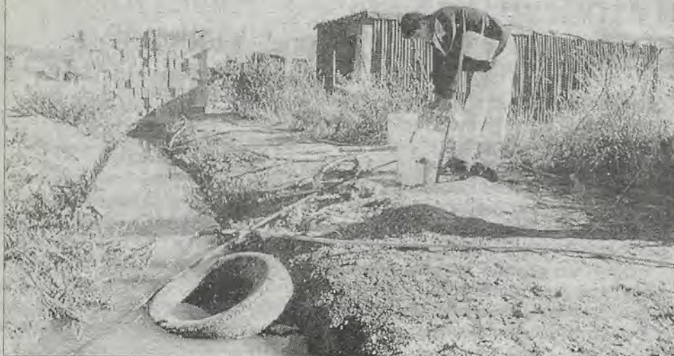
"Ahí vive el cólera".