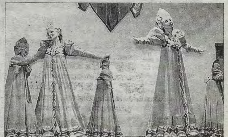
El Ballet Ruso Ghzel el 15 de octubre en el Auditorio del Colegio Fray Luis de León.