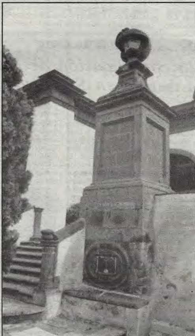
El Museo de la Veracruz: la memoria de San Juan del Río.