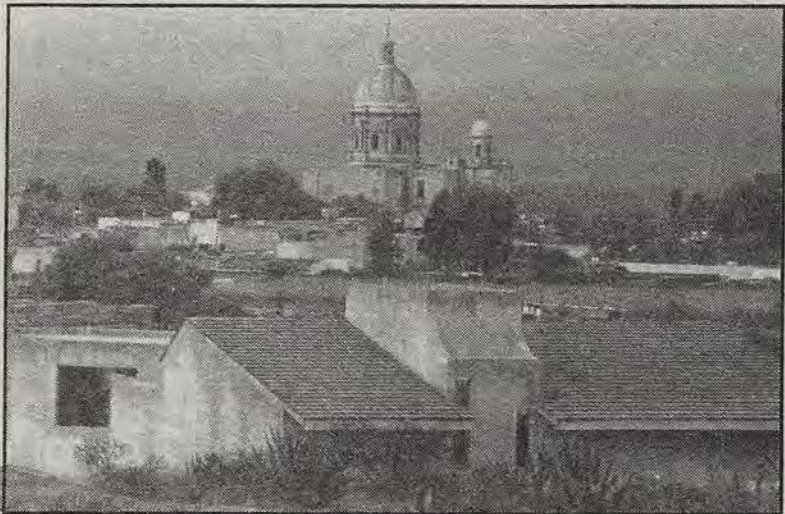
En primer plano, la Casa de las Religiosas, en San José Iturbide, en construcción.