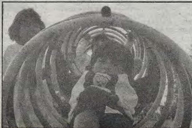
El infante en el espiral