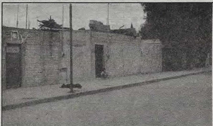
El tiempo nuevo en la calle Manuel Doblado (Reportaje en interiores de Andr s V zquez Hinojosa).