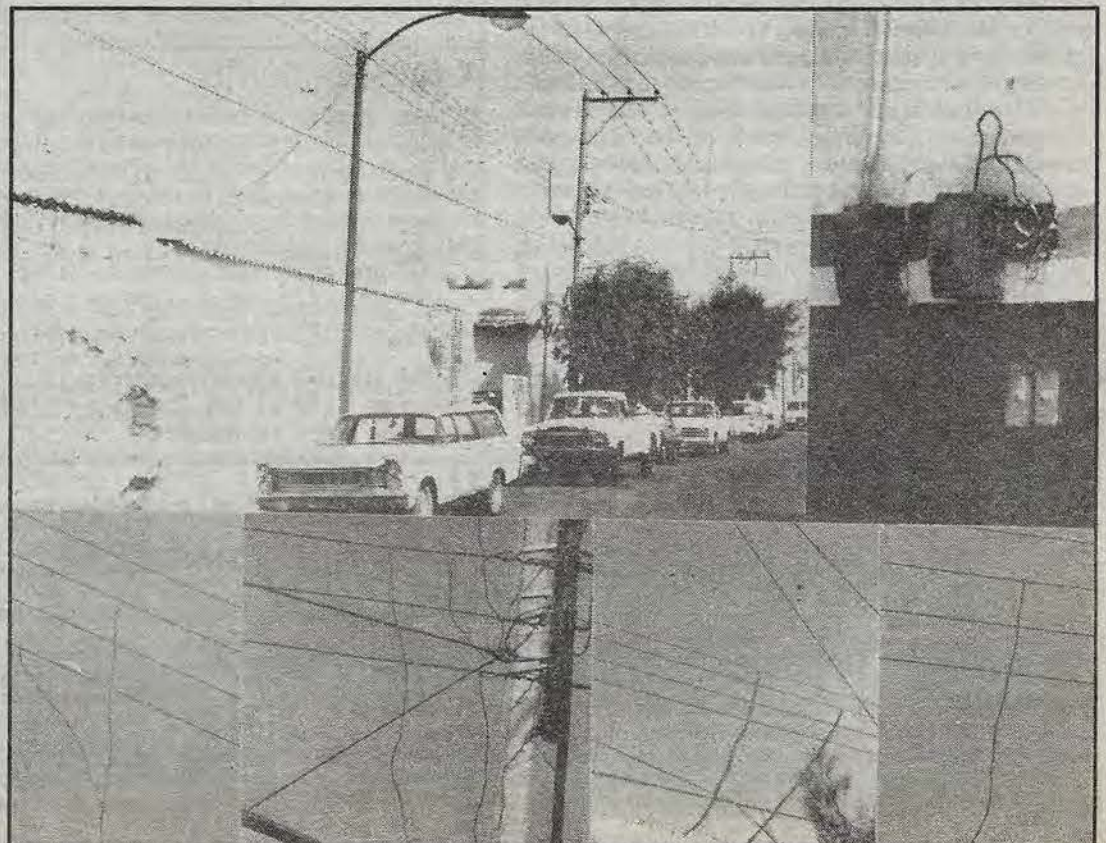
Una red verdaderamente... enredada.