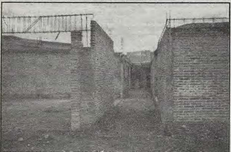
Vista parcial de las instalaciones, en construcción, del asilo de ancianos, a cargo de Caritas de San José Iturbide, A.C.