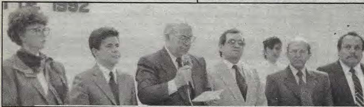
Durante la apertura del ciclo de conferencias "Introducción al Poder Judicial de la Federación", en la UAQ.