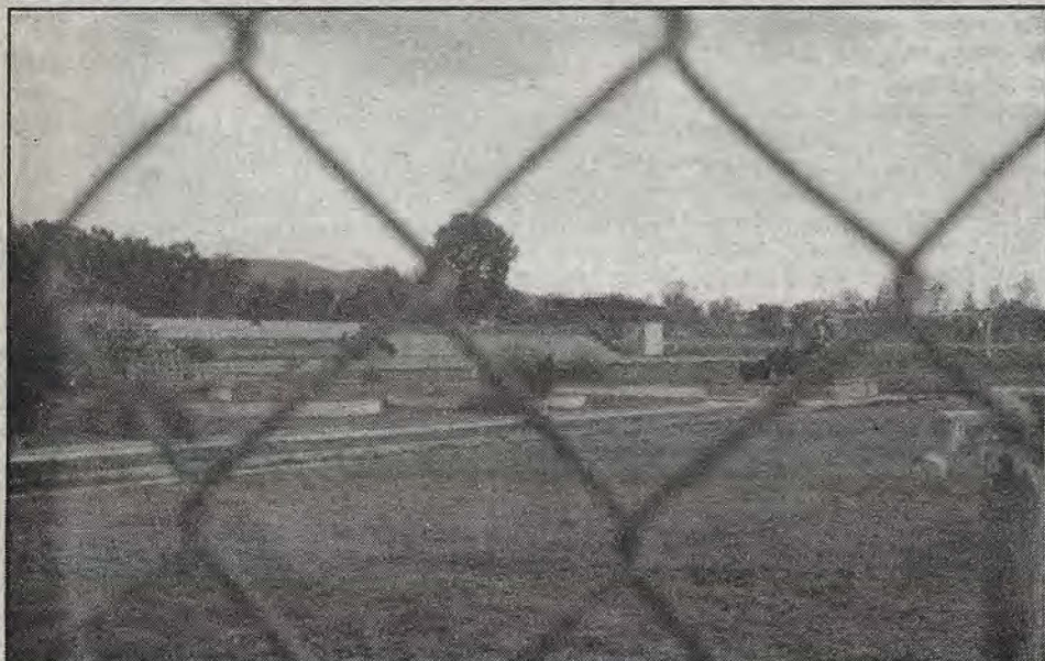
El escenario de cesp  verde. Para el futbol profesional.