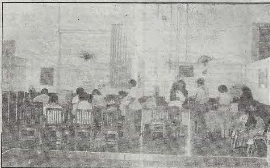
Servicio y eficiencia