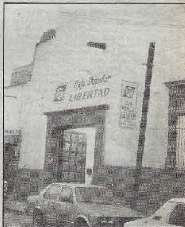
Oficina San Juan