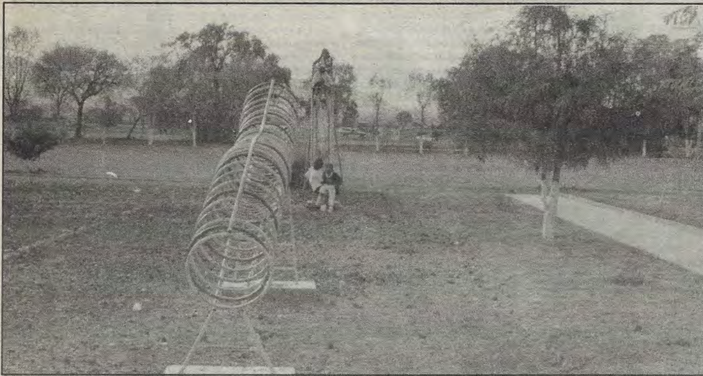
Por la forestación para hacer un pulmón de San José Iturbide