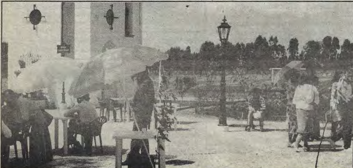
Inició el sábado pasado, el primer torneo deportivo entre las diferentes escuelas e instituciones de San José Iturbide, y los propios socios del Club El Parque.

María Guadalupe Gudiño informa que por petición propia, en breve se construirá un velatorio fuera del panteón municipal para mejorar los servicios en este rubro. "En la última reunión de cabildo, cuando estuvo aquí el gobernador Medina Plascencia, solicité se aprobara la construcción del velatorio y el Ayuntamiento lo aprobó, pero no sé realmente cuándo se inicien los trabajos". Asimismo menciona que el municipio trabaja actualmente para que se mejoren también los servicios del Centro de Salud. "Para que se dé mejor atención a la gente, porque realmente ahí están en condiciones verdaderamente deplorables, me acuerdo cuando hubo aquel accidente en Tierra Blanca, cuando murieron varias gentes y los tenían en el anfiteatro a todos tirados, algunos duraron hasta tres días ahí". (mgh)