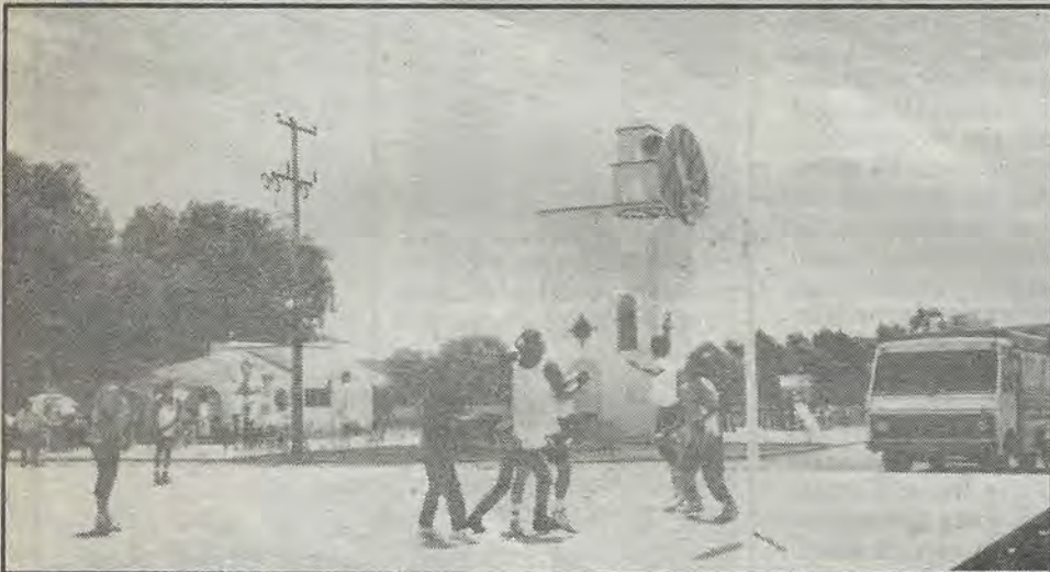
Las canchas de basketbol. Los juegos.