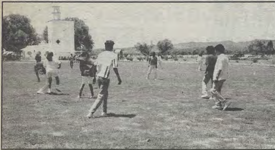
En las canchas de futbol