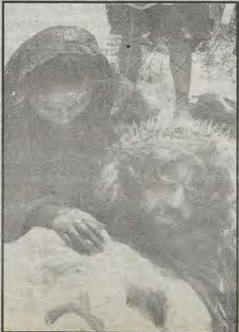
Jesús es bajado de la Cruz

La preparación se hace con una anticipación de 5 a 6 semanas, los ensayos los hacemos de lunes a viernes. Dos o tres días todos los que participamos hacemos un retiro espiritual." finaliza