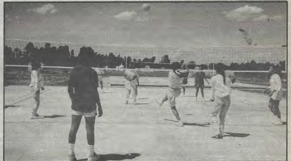
Para el volibol.

El área deportiva donde se realizan actualmente los juegos, cuenta con dos canchas de basketbol y dos de volibol, con redes, postes y tableros con medidas reglamentarias para que haya un mejor servicio. Asimismo se encuentra en el lugar una amplia cancha de futbol uruguayito y un lago artificial que se utilizará como chapoteadero, amén de contar con el excelente servicio de snack bar.