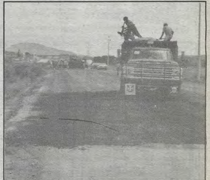
Mantenimiento en la carretera 57