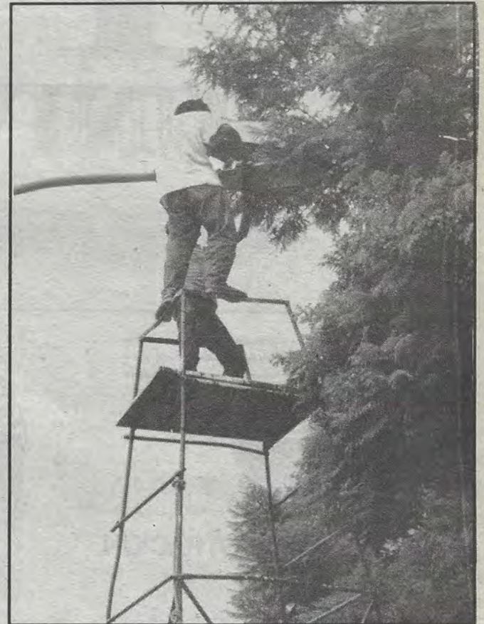
Mejoramiento de servicio. Mantenimiento