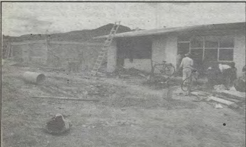
Construcción de la Escuela Miguel Hidalgo y Patria