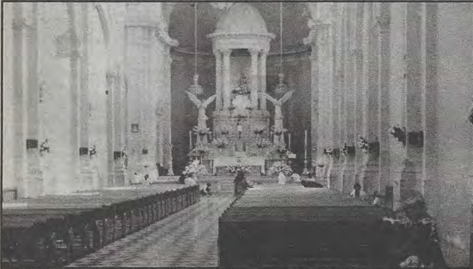
La temporada de fin de año y el inicio de un nuevo ciclo se impone como un momento de reflexión.