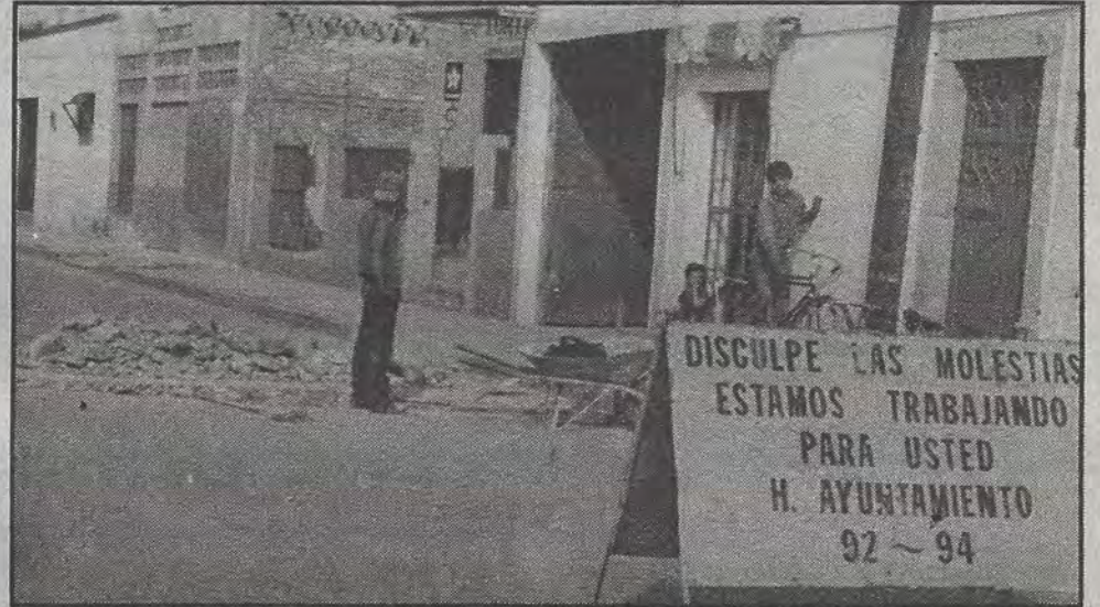
En algunas calles de esta cabecera municipal se realizan obras para mejorar la vialidad y los servicios públicos.