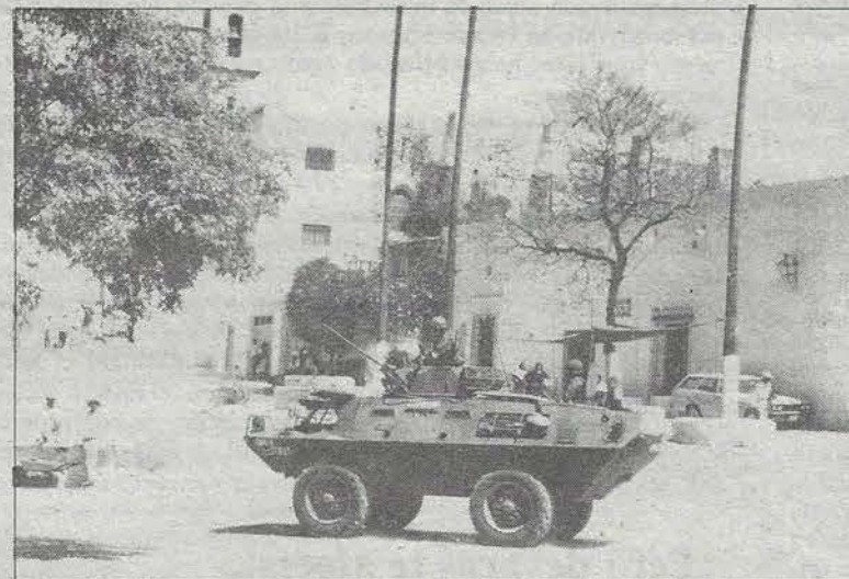
Elegantes y costosas máquinas de la muerte recorren los miserables caminos de La Esperanza, antigua y abandonada hacienda del municipio de Colón. ¿Preludio a la guerra? ¿Preludio a la primavera?

El petróleo es uno de los recursos naturales más importantes con que cuenta el país para su desarrollo. Es un recurso natural no renovable , que tenemos que saber usar racionalmente. La industria petrolera mexicana ha sido, desde su nacionalización, un pilar importante en el desarrollo de la economía nacional, y por muchos años, Pemex fue el principal generador de divisas, lo que permitió un mayor crecimiento en la economía mexicana. A nivel internacional y, sobre todo para los Estados Unidos, el petróleo es un recurso estratégico para el desa-